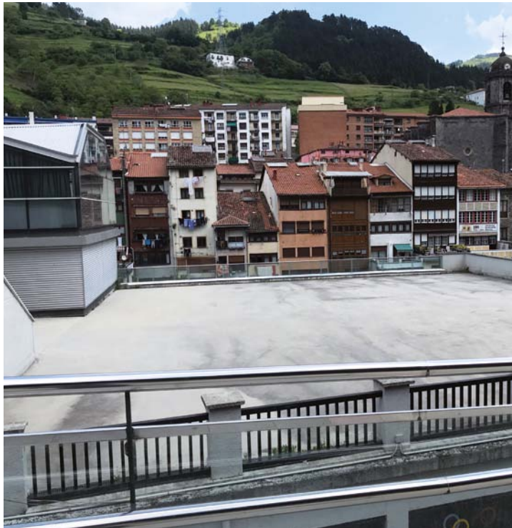
AMPLIACIÓN POLIDEPORTIVO MUNICIPAL ARANE