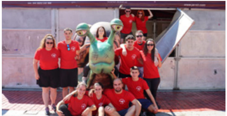
Galatzagorrixak Jai Batzordea txosna aurrean, iaz.

Hain justu, 15:00etan dute mahaiaren bueltan esertzeko hitzordua. Gazte Bazkarirako tiketak salgai daude Iratxo goxo-dendan 10 euroan -zapi eta guzti- eta 150 gazterendako lekua izango da. Martitzenera