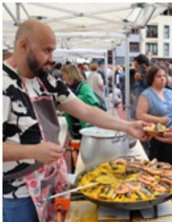
Munduko arrozak iaz.

Horrez gain, aurten ere, eskualdeko gaztaz eta sagardoaz gozatu ahal izango da, Debabarreneko Gazta Dastatzean. Eguenean izango da ekitaldia, 12:00etan, aurten,