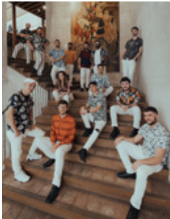
Goxua'n Salsako kideak.

Proposamen ezberdina eta berria da. Behintzat zonalde honetan. Saltsa orkestra tradizionala gara, haize sekzio handiarekin eta hiru abeslariarekin. Gurea proposamen arriskutsua da asko garelako eta taldea