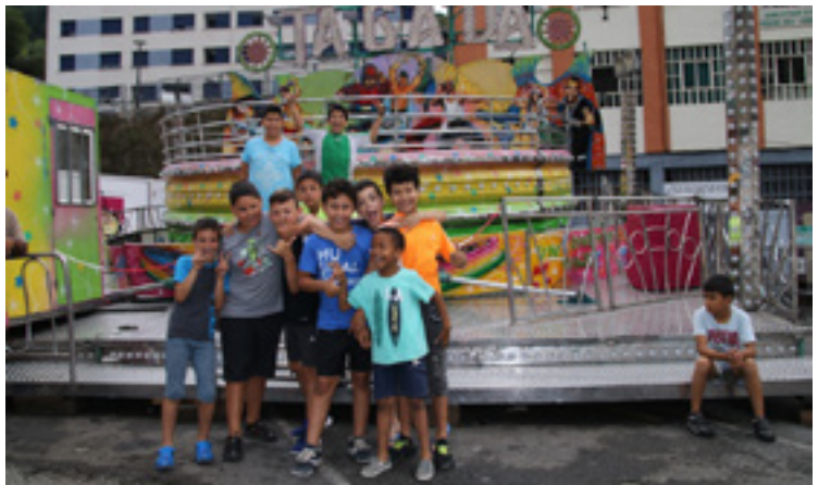
Ume kuadrila La Ollaren aurrean, orain dela urte batzuk.

Adibidez, lehen eta azken egunean, LH5etik DBH4ra bitarteko gaztetxoek bi txapelketa izango dituzte, tortilla lehiaketa eguzten goizean eta herri-kirol txapelketa, berriz, zapatu arratsaldean. Horrez gain, jaien