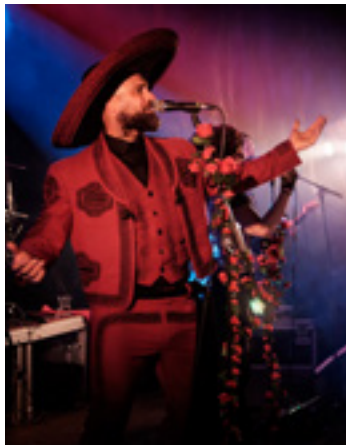
"Konejo" Eseberri Urantzian.

Napar-mex estilotik edan bai, baina Kojon Prieto, Tijuana... eta