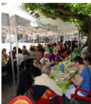
Herritarrek elkarrekin bazkaltzen.

Elkartasun Txosna Taldeak iragarri duenez, txosna egunero 11:00etatik aurrera