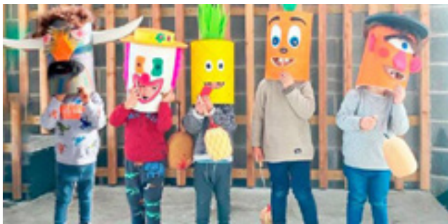
Umeak eurek egindako buruarinekin.