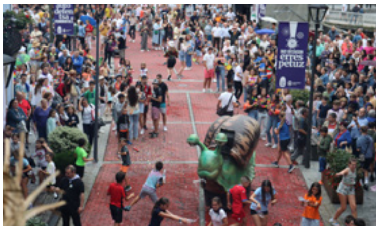
lazko kanoikadaren ostean herritarrek zubian, elkarri gaseosa eta bestelakoak botatzen.

"Urtean zehar gunez gune aritu gara jaiak antolatzeko urratsak ematen, Haur eta Nerabeen Kontseilutik hasi eta parte-hartze prozesu herritarreraino". Gaineratu du horren adierazle dela "herri-eragile mordoa" dagoela "antolaketan zein ekintzetan". Herritarren parte-hartze hori, aldeztu aurretik