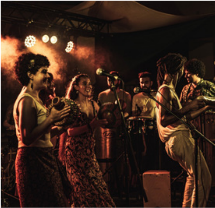
Maracumbé taldea kontzertuan.

aukera polita hirian sortutakoa zuekin nire herri minean konpartitzea.