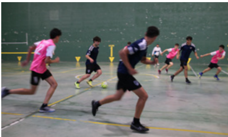
Futbito txapelketako final-laurdenak.