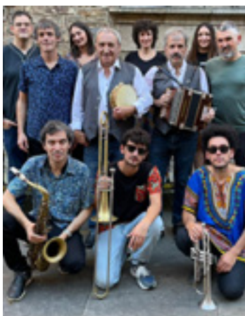
Tapia eta Leturia Band.

Nik trikitixa purua ez dut inoiz ezagutu. Zikina izan zen beti, kanpotik etorritako instrumentua, gure ohitura garbiak zikintzera zetorrena eta hori ia baserri munduan bakarrik kontsumitzen zen; irratietako erreperitorioak jotzen ziren soinu handiarekin, pasodobleak-eta. Gure garaian euskal munduan