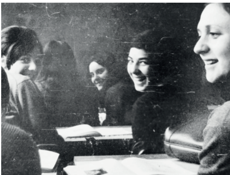
Lehen promozioko ikasleak, gelan.

Esango nuke, hori bai, enpresa munduan itzul-tzaile aritzen ziren emakume langileek prestigio handiagoa zutela".