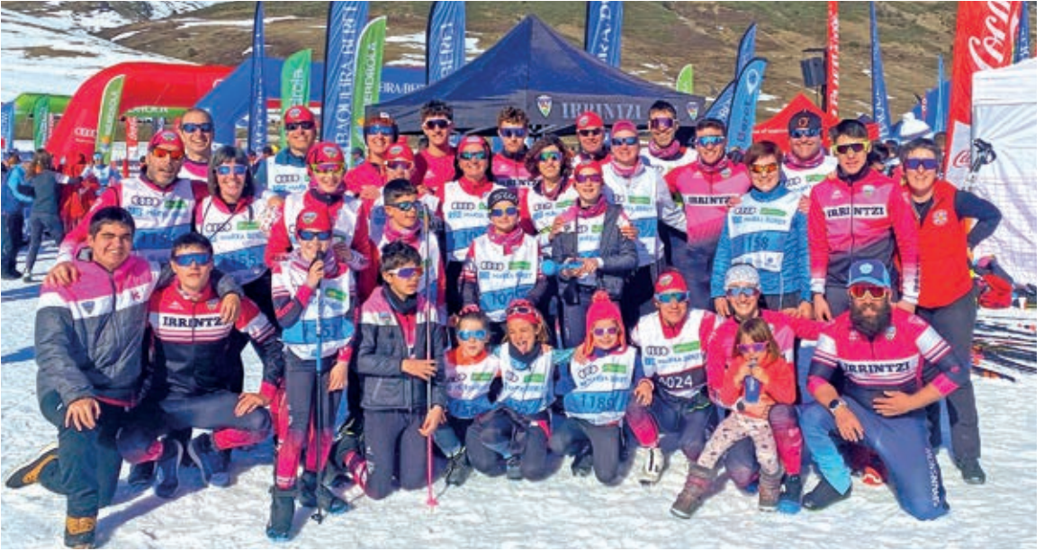
Irritzi taldekoen familia-argazkia.

baina, eta Belaguan ari dira eskolak jasotzen. Elurrik ez dago, baina egia da estazio batzuetan beste batzuetan baino lan handiagoa ari direla egiten dagoen elur hori zaintzeko eta horretan Belaguako estazioa ereduagarri ari da. Iraupen eskiak ez dauka tiradizo handirik ere, eta horrek ere eragina dauka. Beste kontu bat ere badago: beste kirolean, dela futboleko eta eskubaloian esaterako, konpromiso handia eskatzen diete umeei, behin 10 urte betez gero. Ume horiek ez dute aukerarik izaten beste kirol bat probatzeko, astebururo izaten dituztelako partidak. Are, familia-plan bat egiteko aukerarik gabe ere gelditzen dira askotan, eta hori niretzako arazo bat da, kirol horiek gizartearen duten indarragatik beste ate batzuk ixten dizkietelako umeei.