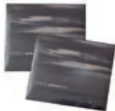
Leok'k musika cd-ak