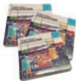
'Elgoibar koloretan' mahai-jokoak