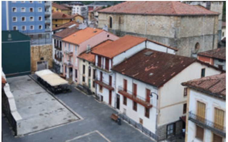
Plazako frontoi nagusiaren ondoan, hainbat pilotariren jaiotetxeak. E. GONZÁLEZ

Herrigunerantz abiatuko gara, Batzokiraino. Ostean frontoia du: 1935an eraikia, Frontoi Barrixa bezala ezagutzen zuten. Astero batzen dira bertan gaur egun ere pala edo esku-pilotan jarduteko, eta bilgune bihurtu da pilota eta hark dakarren lagunartea maite dutenentzat.