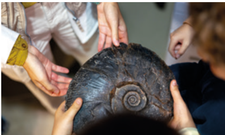
Amonite ikusgarriek osatzen dute Nautiluseko bilduma. MUTRIKUKO UDALA

Nautilus Mutrikuko Interpretazio Geologiko Zentroa ezagutzeko