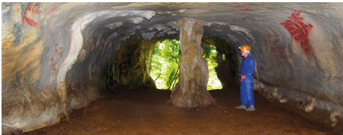
Aitzbeltz kobazuloko ataria eta sarrerako galeria. MORKAIKO-LEIZARPE TALDEA

LEIZEA ETA ONDARE PALEONTOLOGIKO ABERATSEKO KOBAZULOA