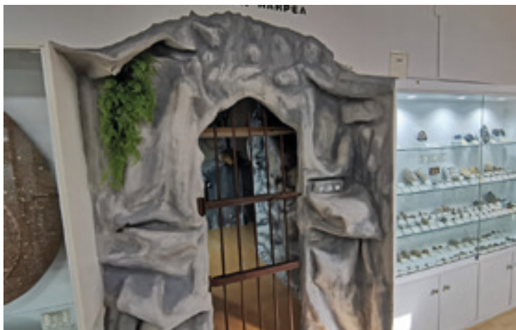
Europako koba ezagunenetako irudien erreplikak marraztu dituzte koban.

Hiru urteko lanaren ostean, historiaurreko koba baten erreplika egin dute museoaren azpiko aldean. Bost gunetan banatu dute koba, eta bertan jasotako margoen bi-