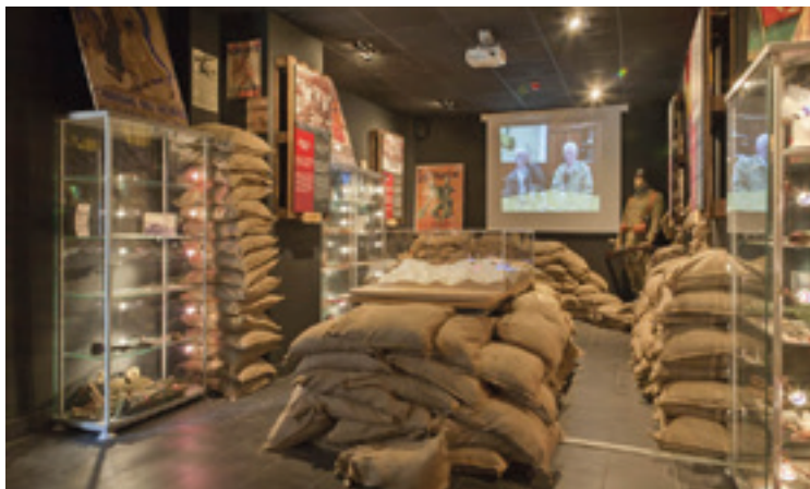
Gerra Zibileko Interpretazio Zentroa. EIBARKO UDALA

Ibilaldiak Untzagara jotzen du gero. II. Errepublikaren aldarrikapenaren eta 1934ko urriko iraultzaren berri ematen da bertan,