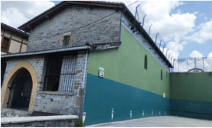
Sallabenteko frontoia. ESTIBALITZ GONZÁLEZ.