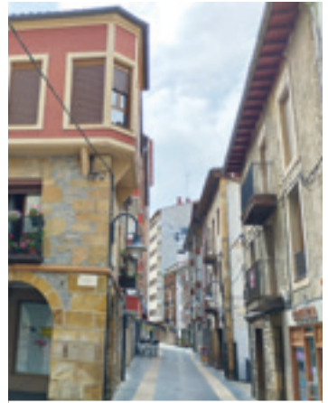
Santiago plaza eta Erdikokale. E. G.