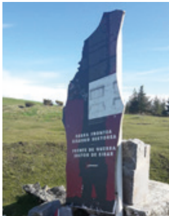
Informazio panelak jarri dituzte.

eta, besteak beste, udaletxeko fatxadan ikus daitezkeen zuloen jatorria zein den azaltzen da.