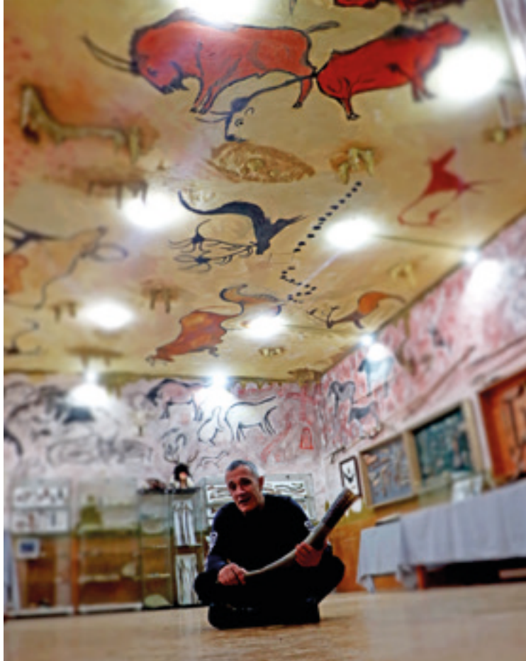
Hezur museoko hormak eta sabaiaik koba itxura ematen diote museoari.

duraduna, eta guzti honen oinarrian bere zaletasuna dago. Mimos, pasioz eta maitasunez sortutako obra da Hezur Museoa, eta bertan dauden pieza eta elementu guztiak Marquizek berak eskuz egindakoak dira.