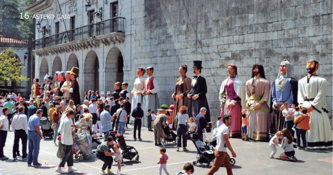
Iaz Mauxitxa txarangak antolatu zuen erraldoi topaketan ateratako argazkia.