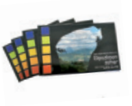
"Gipuzkoan zehar" liburuak

Aurten bai! Aurreko urteetan TONBOLAK izan duen estimazioak bultzatuta, abenduaren 24an, 11:00etatik aurrera , Elgoibarko Izarraren tonbola jarriko dugu Kalegoen plazan . Hasi gara opariak jasotzen! Eskerrik asko!