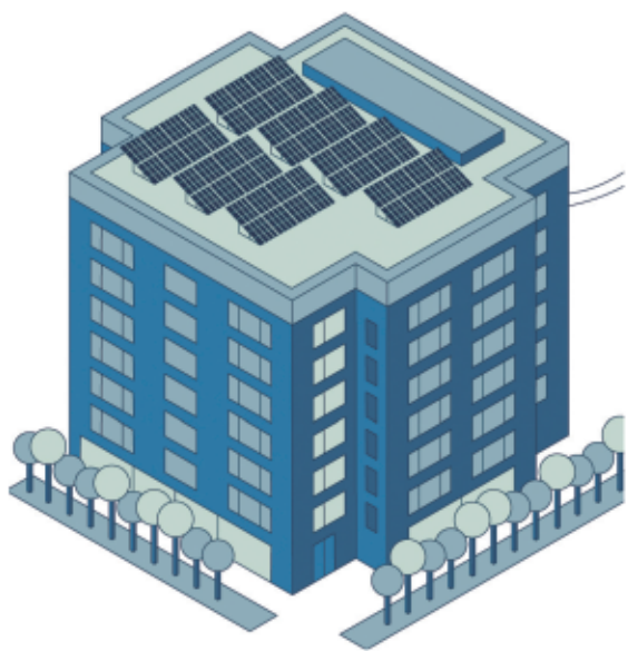
Energia Bulegoan gero eta kontsulta gehiago jasotzen dituzte eguzki-plaka fotovoltaikoen instalakuntzaren inguruan.

Berotze-sistemen inguruan galdetzen digute nagusiki. Gasaren eta elektrizitatearen egoera