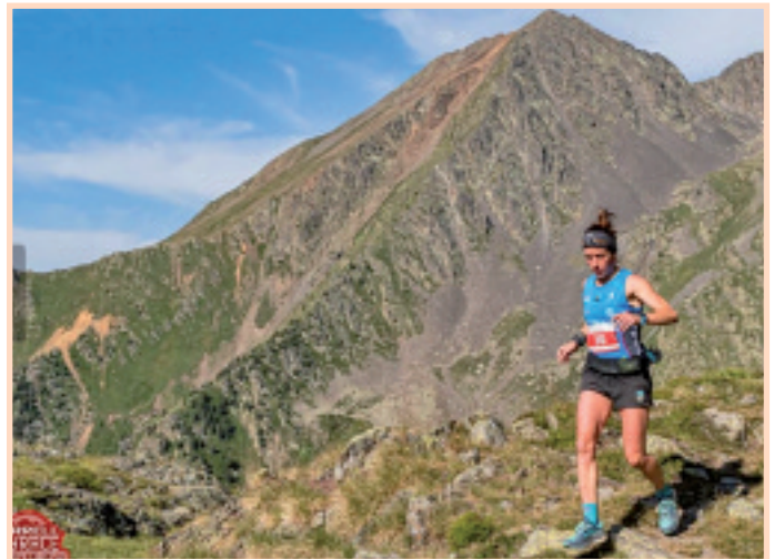
Merrel Sky Race Comapedrosa, Andorran.

“Lasterketa gogorak eta teknikoak nahiago ditut”