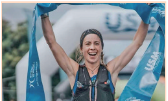
Madeira Sky Racen irabazle.