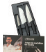
Sukalderako laban sorta