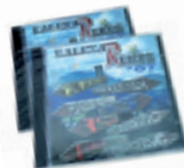
"Kalexar Rekos" musika cd-ak