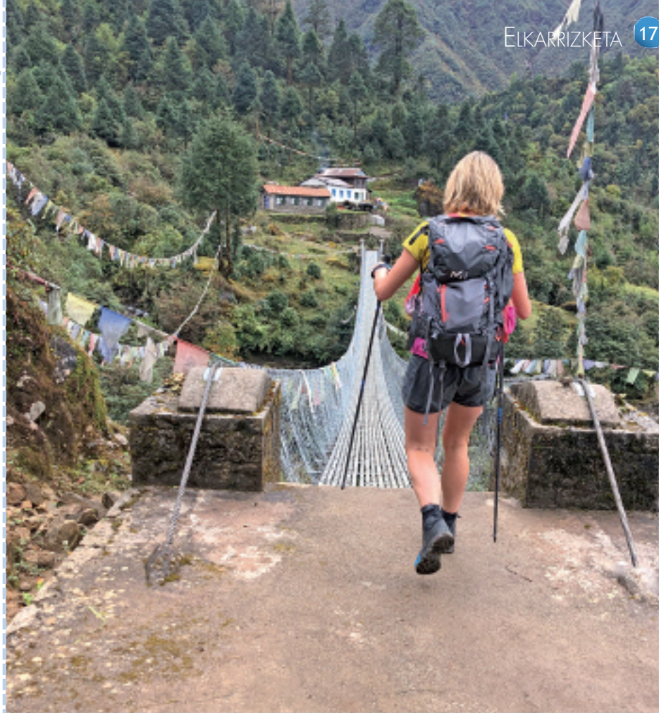
Goian, Ainhua, zubi tibetarra pasatzeko prest, trekingaren hasieran, Luklatik gertu. Behean, taldekoei lagundu eta jatekoa prestatu zien familiako hainbat kide.

Alpeetako gidariari galdetu nion zein zen Elbrusera joateko urte sasoirik onena, gainontzeko mendi egitasmoak antolatzeko. Bi egun hemen pasatu orduko burua mendi gailurretara eta beste leku batzuetara joaten zait. Datorren urtean, beharbada, Himalayara bertara joango gara edo Perura, Andeetara. Dena dela, orain lehen helburua Karakateko Igoera da. Txisparrigabe nago, baina saiatuko naiz Himalayako azken globuluak estutzen. Nire ilusioa da nire ilobak han goian ikustea. Pentsatu dut aurten lehen aldiz erlojurik gabe joango naizela berdin baitzait zein denbora egin. Konfinamendutik, operazioaren ondoren hiru bertikal egin ditut dortsalari beldurra kentzeko eta hiru horietan baino ez dut erlojua ipini, Himalayara eta Alpeetara ez dut eraman. Hala ere, nire mailan baina oso lehiakorra naiz eta Karakatera joaten naizenean erlojurik eraman ez arren, beti begiratzen diot gure dendako erlojuari iristen naizenean. Gozatzeri joango naiz, eta amaituz gero pozik.