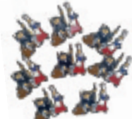
Olentzero eta Mari Domingiren pin-ak