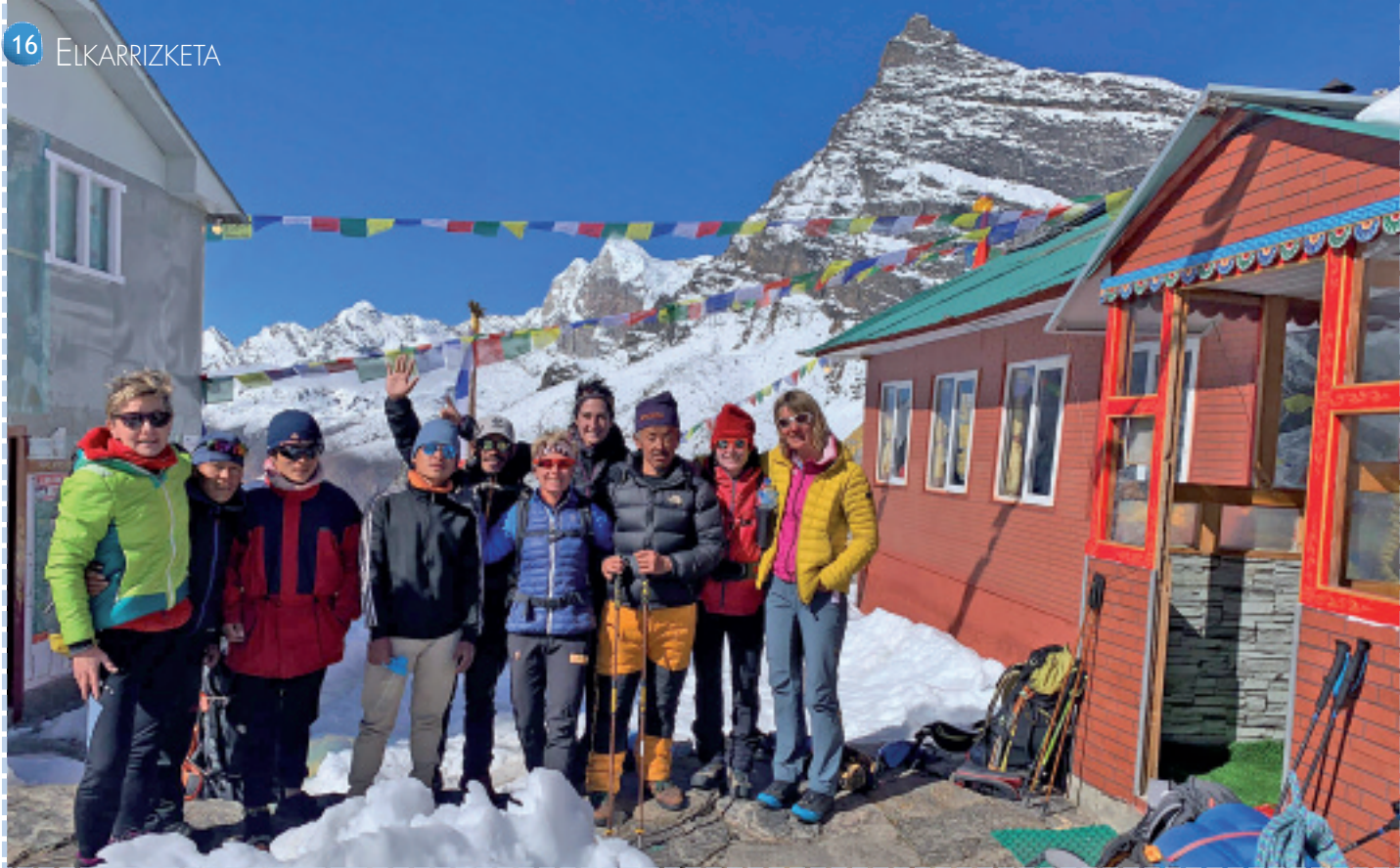
Espedizioko talde guztia, sherpa eta zamaketariekin, Kharen (4.900 metro).

malko bota eta azken 20 minutu horiek izan ziren gehien gozatu nituenak. Espedizioan gustura ibili arren, egun hori kalbario bat izan zen. Ezin dut imajinatu 8.000 metroko bat zer den.