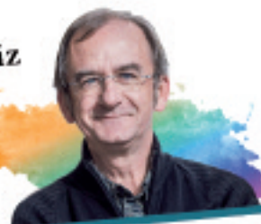
NINGRA GARAZI ARRULA NEREA IBARTZABAL

Euskalduntasun onak eta txarrak: naturaltasuna auzitan.