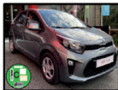
PICANTO CONCEPT ASTRO GREY 10.500 €