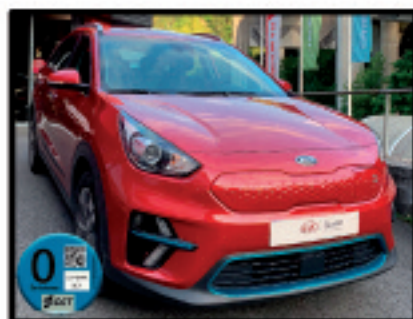
KIA eNIRO DRIVE (100kw) 22.900 €