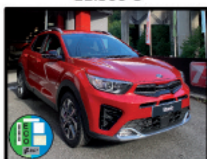
STONIC 100CV MHEV GT-LINE 18.900 €