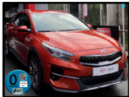
XCEED PHEV TECH ORANGE 22.900 €