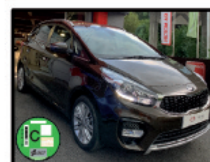
CARENS 1.6 GDI 132CV DRIVE 5P. 14.800 €