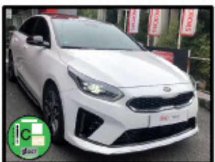
PRO CEED GT LINE PACK PREMIUM 24.900 €