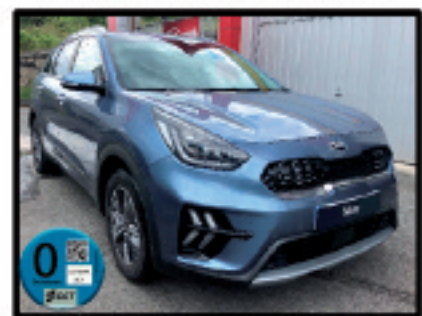
NIRO PHEV EMOTION PACK LUXURY 26.000 €