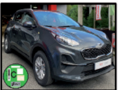
SPORTAGE 1.6 CRDI 115CV CONCEPT - 21.800 €