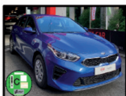
CEED 5P. 120CV T-GDI CONCEPT 15.900 €