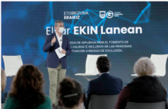
Gipuzkoako diputatu nagusia, Elkar Ekin Lanean estrategia aurkezten.