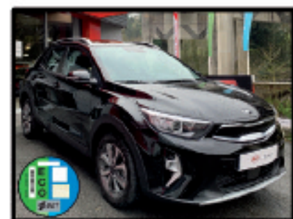
STONIC DRIVE DCT NEGRO 18.500 €