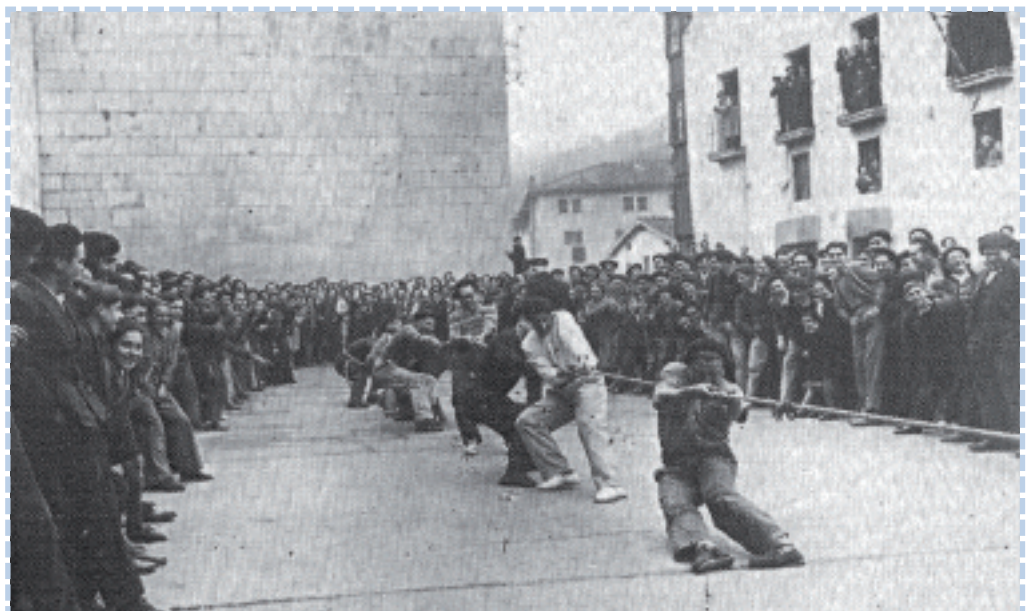
1933ko argazkia. Sokatira saioa Elgoibarko Kalegoen plazan.

Garai batean baino gutxiago erabiltzen da, baina Elosegi fabrikakoek esana digutenez, batez ere esportatzeko ekoizten dituzte txapelak. Eta ulertzekoa da, munduan armada askoren uniformearen parte delako gaur txapela.