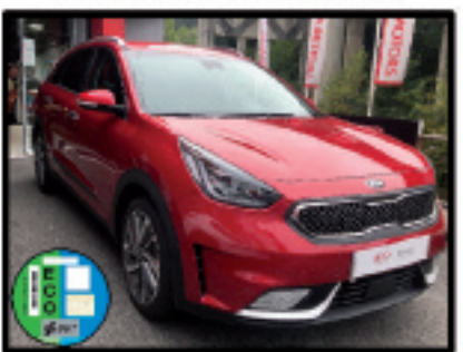
NIRO EMOTION RUNWAY RED 22.000 €