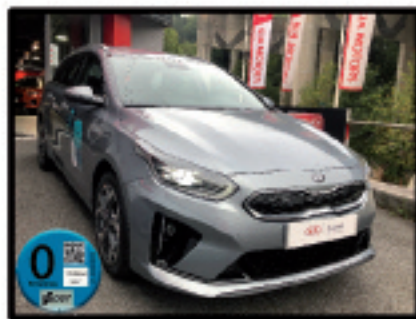
TOURER PHEV TECH LUNAR 22.850 €