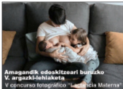
Amagandiko edoskidetzeari buruzko V. argazki-lehiaketa V concurso fotográfico "Lactancia Materna"

Bizitzako lehenengo sei hilabeteetan haur batentzat amaren esnea baino elikagai hoberik ez dagoela sinistuta daude Debarrenako ESIn. Horregatik, Debarrenako ESIn amagandiko edoskidetzeari buruzko argazki lehiaketa hau ere duela bost urte. Irailaren 16an zabaldu zuten argazki lehiaketan parte hartzeko epea eta azaroaren 16ra arte jasoko dituzte argazkiak, bpsosidebarrena@osakidetza.eus helbidean. Parte-hartzaileek gehienez hiru argazki aurkeztu ahal izango dituzte, koloretan nahiz zuri-beltzean. Argazkiarekin batera inskripzio dokumentua eta irudia biltzeko eta zabaltzeko baimena erantsi beharko dute parte hartzaileek. Sari banaketa ekitaldia abenduan egingo dute Mendaroko Ospitalean.