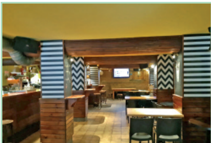
Dekorazio berezia izan du beti Iriondo tabernak.