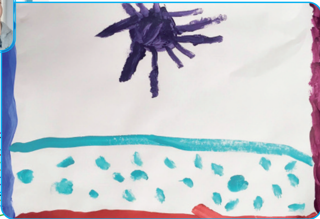
"Itsasoa eta eguzkia"