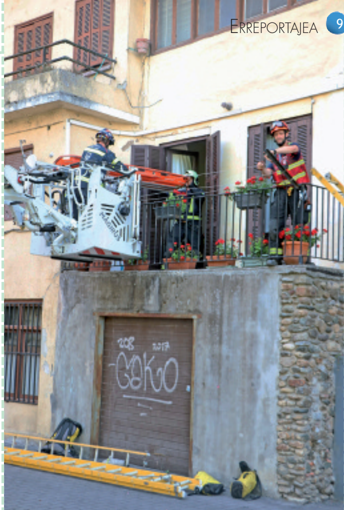
Suhiltzaileak, barixakuan, San Bartolome kaleko 2 eta 4 pe-oretako jendea etxetik ateratzen Lekueder plazara.