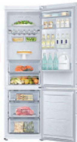
COMBI SAMSUNG R37J5325WW

Hezetasun neurgailua B maila energetikoa 8kg / Display LED