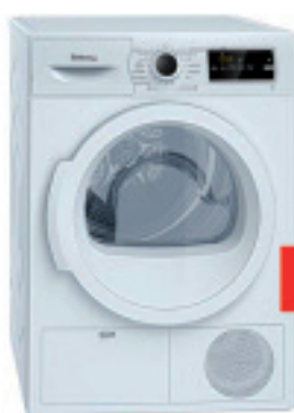
BALAY 3SC187B ARROPA LEHORGAILUA

iQdrive motorrak, 10 URTEKO BERMEA A+++ / 7kg-ko karga 1200 r.p.m. / Display LED