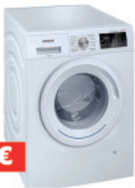
SIEMENS WM12N260ES ARROPA GARBIGAILUA