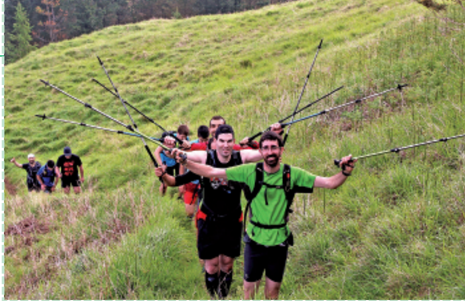
Elgoibarko mendi itzuliko irudia.

Baina bestelako administrazio kontuen eta Federazioarekin, Udalarekin eta bazkideekin izan beharreko harremanen ardura geuk dugu. Hori, eta baita Karakateko Igoera eta Morkaikoren Eguna antolatzeko ere", zehaztu du. Gero, esan bezala, azpialdeak ditu Morkaikok. Bi-hiruna bazkidek osatzen dute talde horietako bakoitza eta nor bere gustuko ekintzak antolatzen ditu, nor bere ahale eta indarren arabera: haurrentzako irteerak, nagusientzako ekintzak, ohiko mendi irteerak, BTT martxak, mendi segurtasunari buruzko ikastaroak, mendi eskia, espeleologia, raid taldea, haurrentzako irteerak, natur eta ondare taldea eta emanaldietarako lantaldea. "Lanerako konpromisoa duen jendea inguratzea kostatzen zaigu, gainerako elkarteei bezala. Gai jakin baten inguruan interesa duenak derrigorrean ari den batek baino ilusio handiagoz