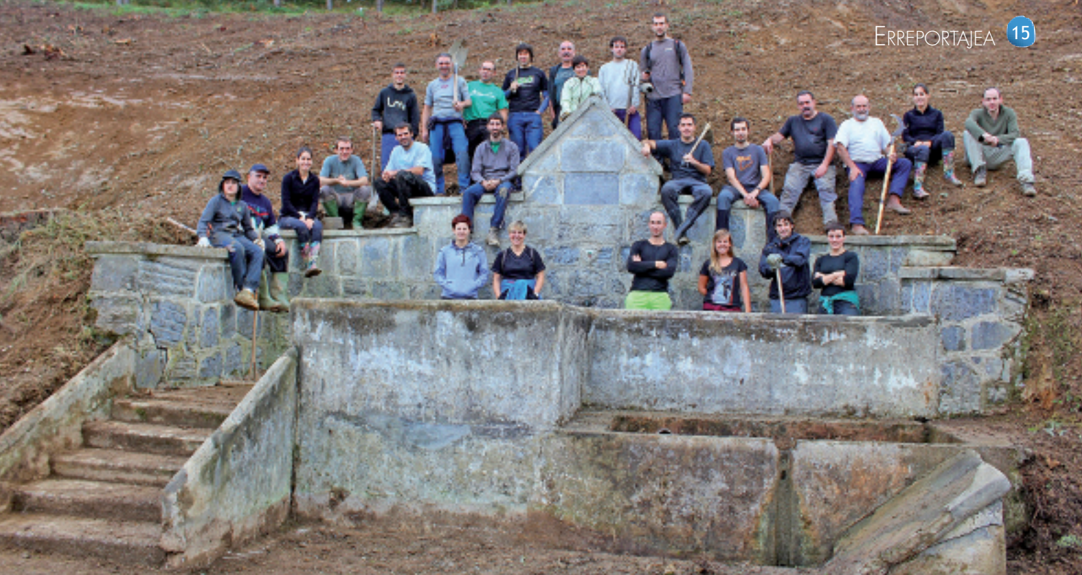
Morkaikok Sargoateko iturria berri zueneko argazkia.