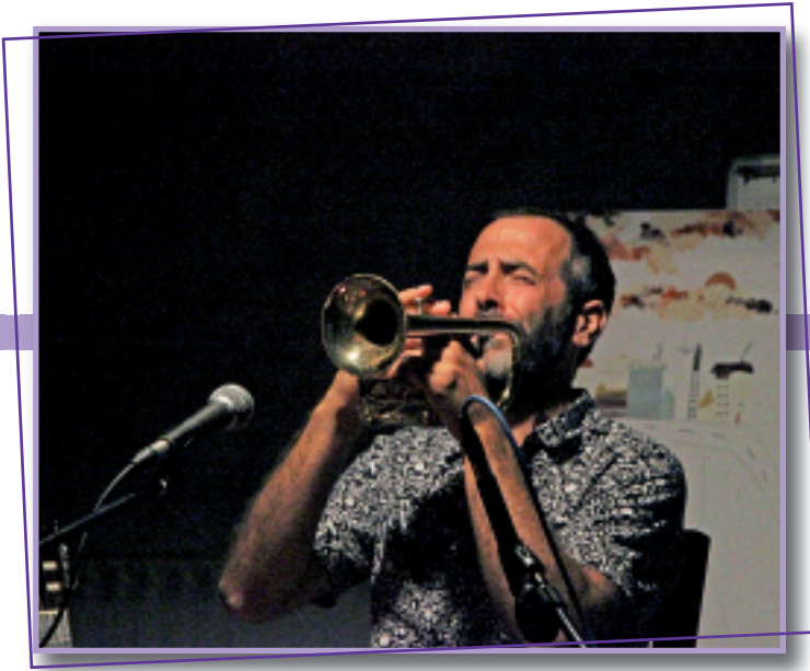
Iban Urizar Amorantek eman zion azkena aurtengo Euskara ala ezkara zikloari, Kultur Etxeko sotoan eskaini zuen emanaldia-rekin.