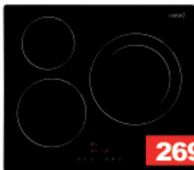
IB 6303BK CATA SUKALDE-GAINEKOA

23:30 Kontzertuak gaztetxean. Jo ta lto (Mendaro) eta Guri 5 taldearekin erromeria.