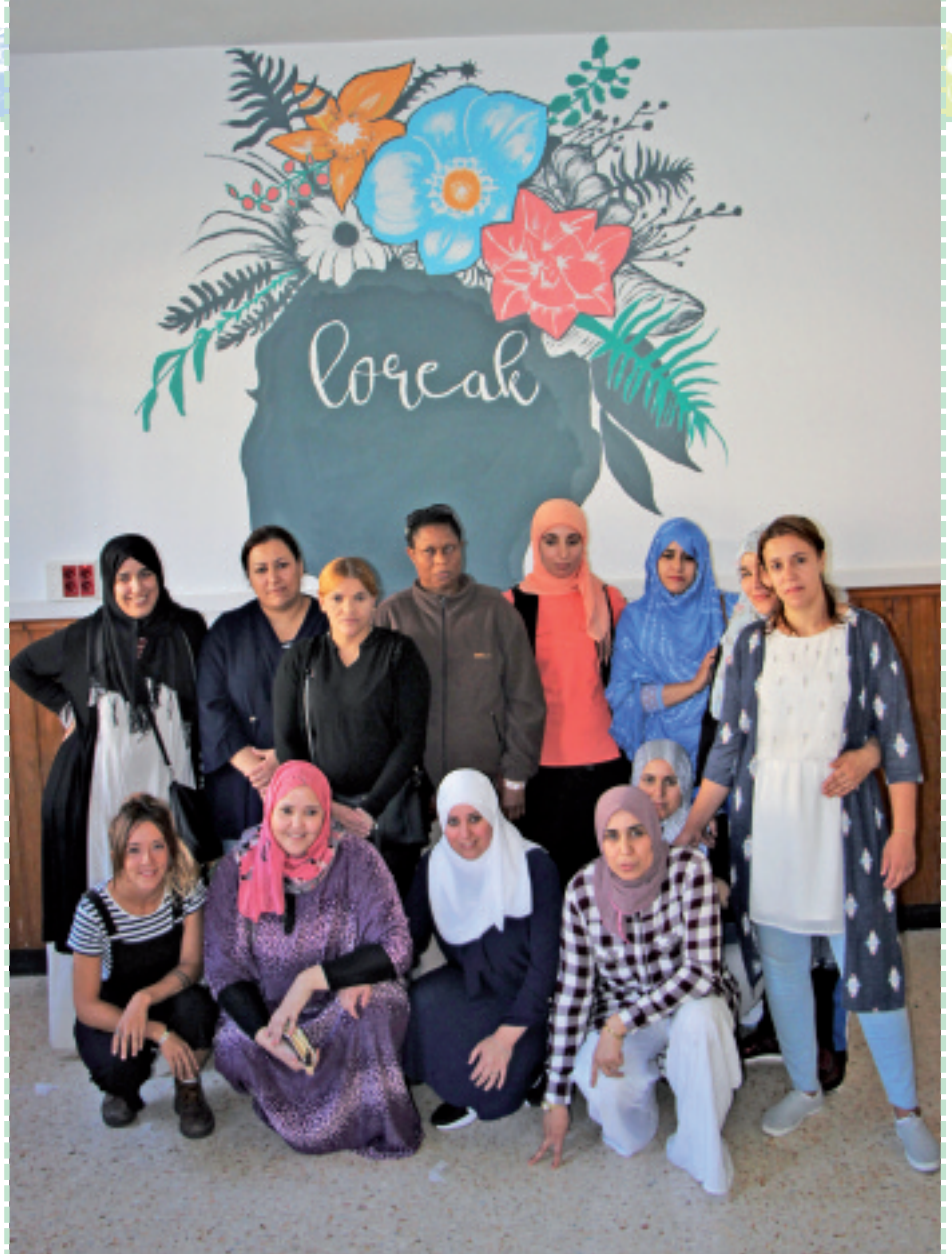
Joskintza tailerrean dabilzan emakumeak.