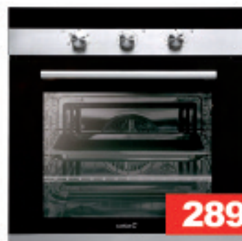
CM760 AS BK CATA LABEA

Kondentsazioa Soft Care dariborra B 7 kg