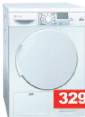
3SC871B BALAY LEHORGAILUA

3 gune Booster funtzioarekin 9 potentzia maila Gune bakoitzean tenporizadorea Indukzioa