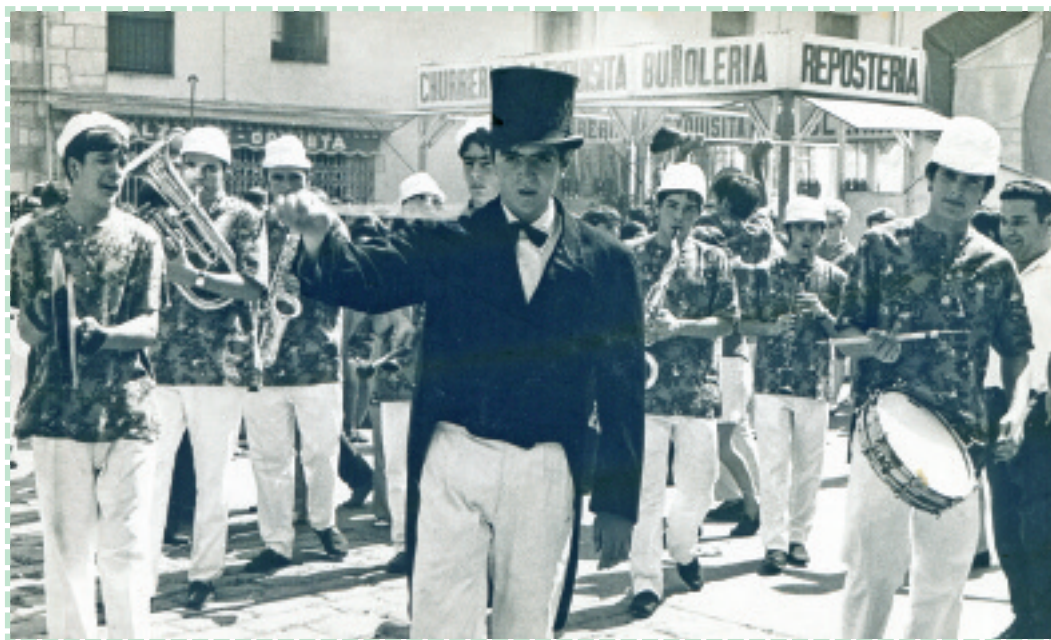
1970ko abuztuaren 25ean txarangakoak eta kuadrillakoak lorehun kasaka jantzita.