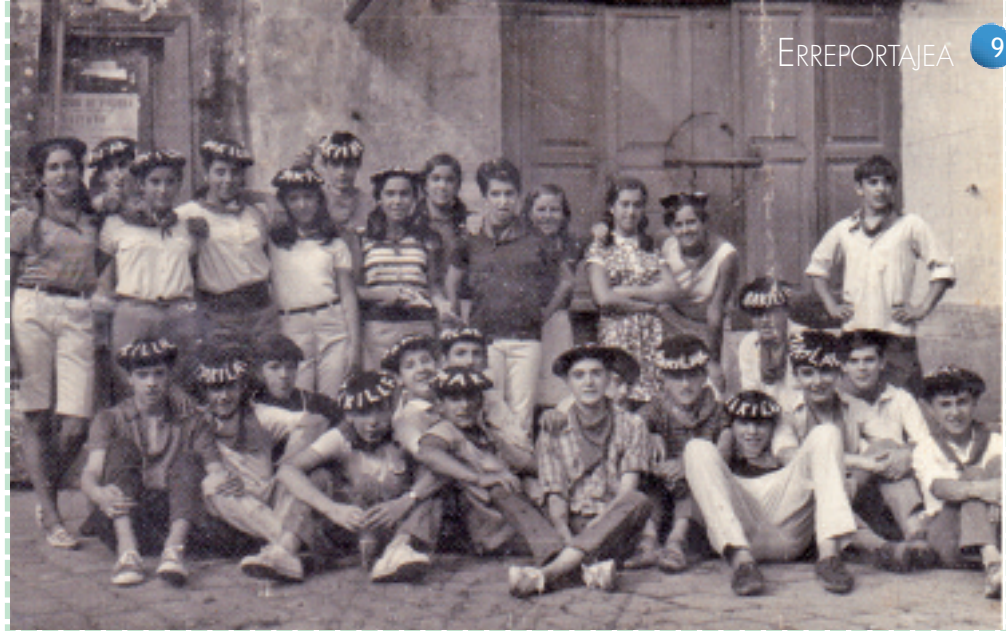
Makillak kuadrillako hainbat lagun neskak eta mutilak elkartu ziren lehen Txiki Egunean, 1968an.