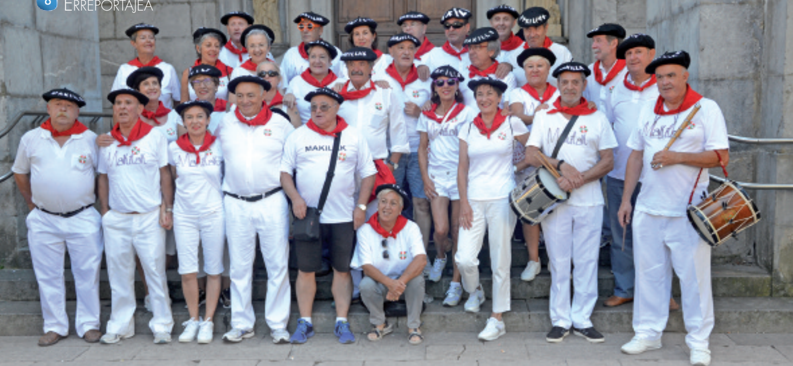
Makillak kuadrilla abuztuaren 27ko ospakizunean.