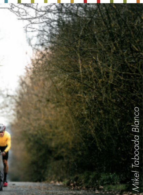
Mikel Taboada Blanco