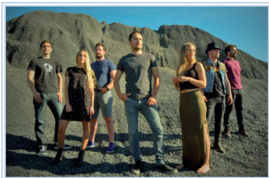
Hesian taldeko musikari eta abeslariak.

Oholatza ginean nagoela, ikustea jendeak badakizkiela gure abestiak eta gurekin batera kantatzen dituztela. Sekulakoa da hori. Eta horri gehitu kantuan ez ezik publiko horrek sentitu ere egiten dituela guk horrenbeste mimorekin sortutako doinu eta kantuak. Izugarria da hori.