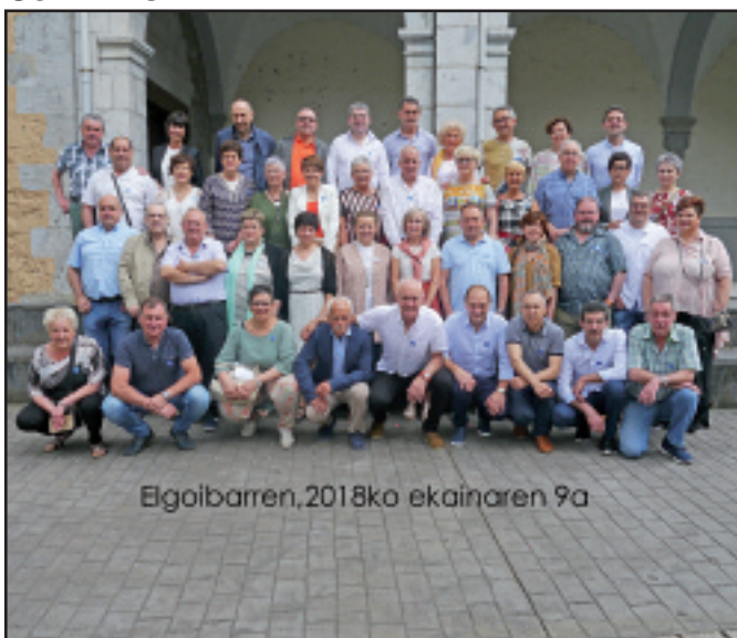
Elgoibarren, 2018ko ekainaren 9a

Guztiok elkarrekin oso ondo pasa genuen 59 urtekoen bazkarian. Eskerrik asko antolatzaileei eta bertaratu zineten guztioi.