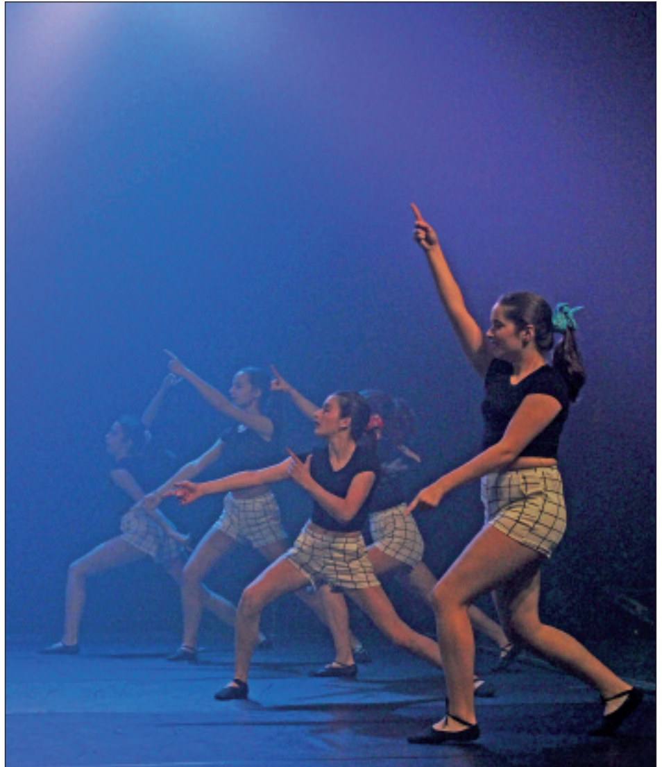
Biraka taldeko dantzariak.

Eibarren lau saio eskaini zituzten joan zen astean, Coliseoan, eta Soraluzeko ki-