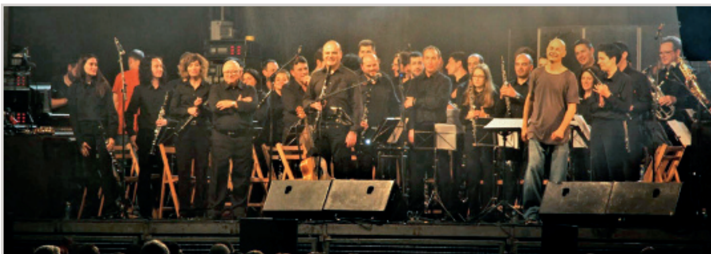
laz Celtas Cortos taldearekin Kalegoen plazan eman zuten kontzertuko une bat.