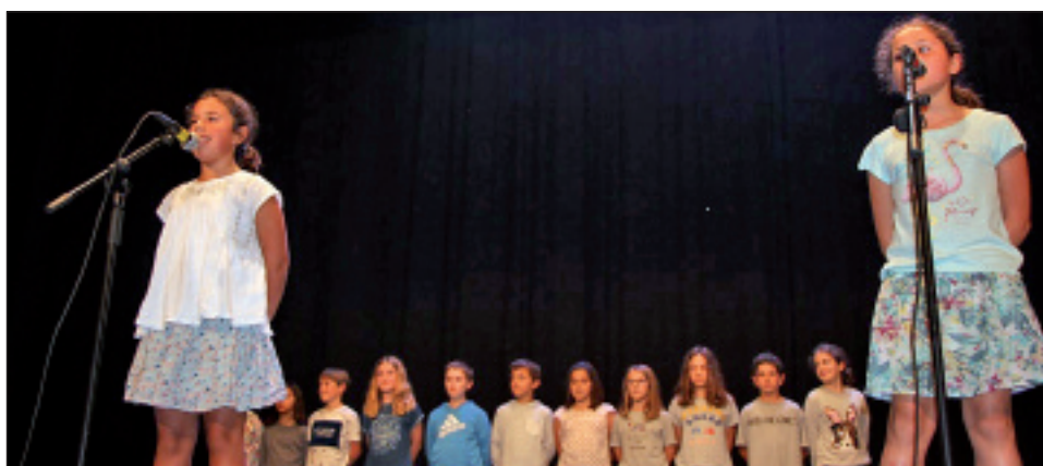
Elgoibar ikastolako haurrak kantuan.