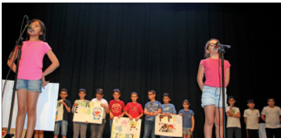
Herri Eskolako umeek marrazki bizidunetako pertsonaiei buruz kantatu zuten.