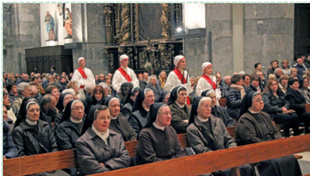
San Bartolome parrokia bete egin zen mojei egin zieten omenaldian.