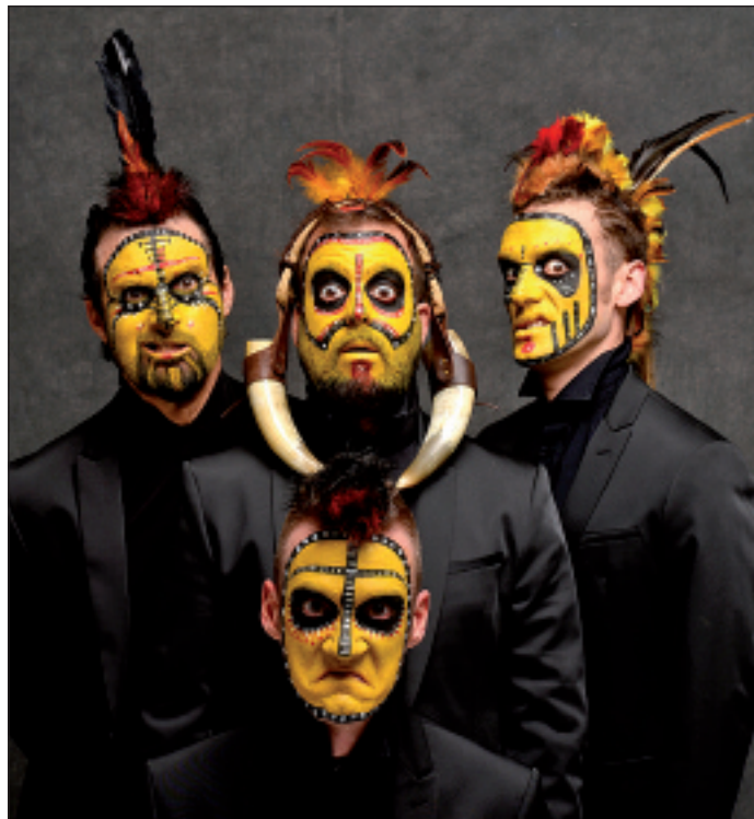
Tribu bat irudikatuko dute lau antzezlek.

Ez da musikal batere ohikoa, beraz, ikus-entzuleei gogotsu, esperientzia berezia bizitzeko asmoz eta barre algarak egitera joateko gomendioa egin diete antzerkigileek.