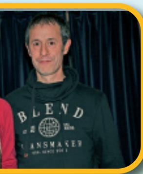
(La Union, ehiza)