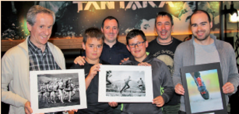
Argazki lehiaketako sarituak antolatzaileekin.