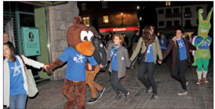
Ludo eta Kiribil ere irten ziren Elgoibarko Izarrarekin.