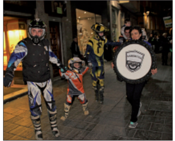
Motorista jantzita Urnabitza taldekoak.