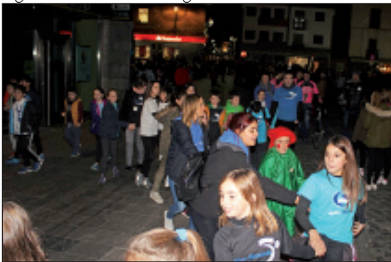
Elgoibar Ikastolakoak Argitxorekin irten ziren kalera.