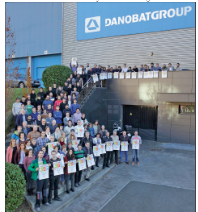
Danobatek ere Euskararen Egunarekin bat egin zuten.