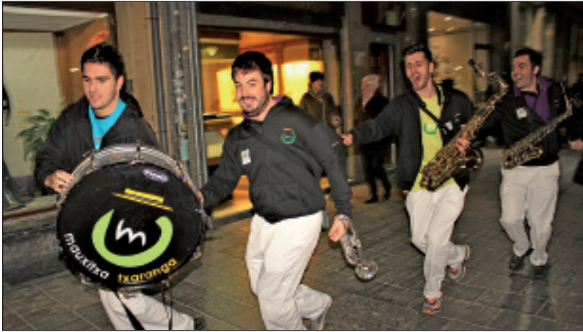
Musika eta umorea uzartu zituzten Mausitxako kideek.