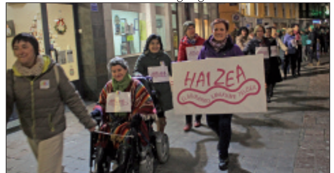
Haizeakoek ere ez zuten huts egin giza katean.