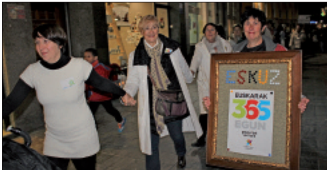
Eskuz Taldekoak ere, eskutik emanda.