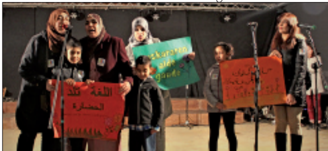
Loreak taldekoak ere euskararen alde agertu ziren.