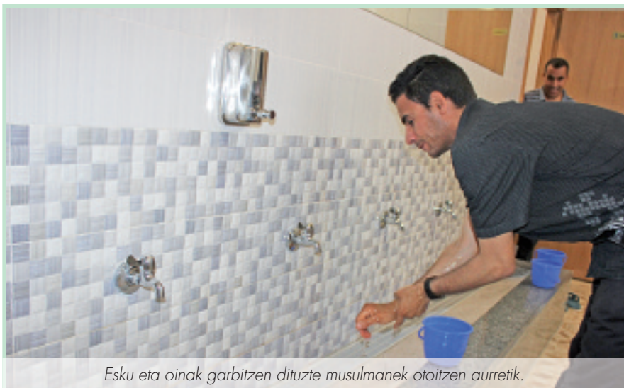
Esku eta oinak garbitzen dituzte musulmanek otoitzen aurretik.