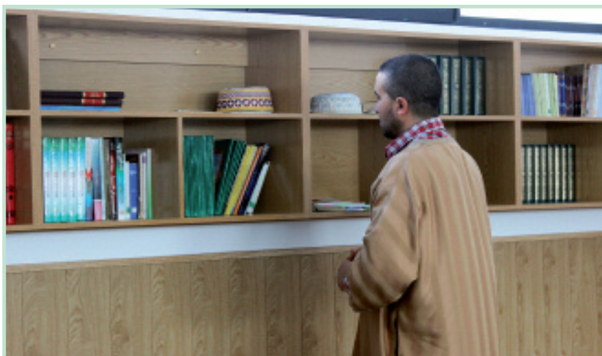
Liburuak dituzte gela nagusian, baita seme-alabek eskolak jasotzeko gela bat ere.

Modu askean otoitz eta berba egiteko gune berria badute, bada, Elgoibarren eta inguruetan bizi diren musulmanek.