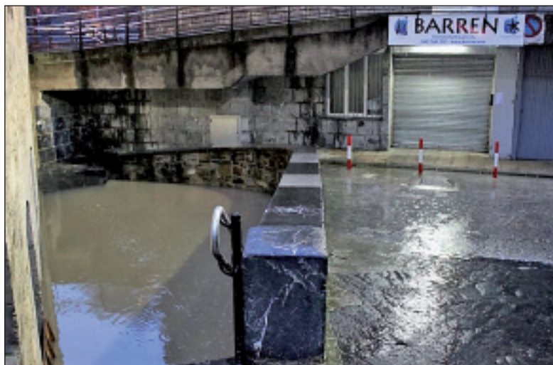
BARREN salbu gelditu bazen ere, Kultur Etxeko sotoan ura sartu zen.