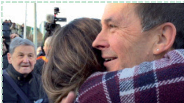
Senitartekoak besarkatzen (argazkia: Aitziber Arregi).