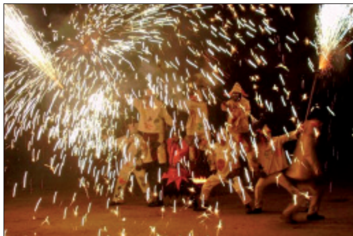
Os Diaples D'a Uerba taldeak su ikuskizuna egingo du.

Bazkalostean ere ez da jai girorik faltako. Izan ere, Debatik musika elektronikoa ekarriko dute eta Inozentzio clownak beste urteren batean egun horretan egin izan duen bezala aurten ere bere showa eskainiko du.