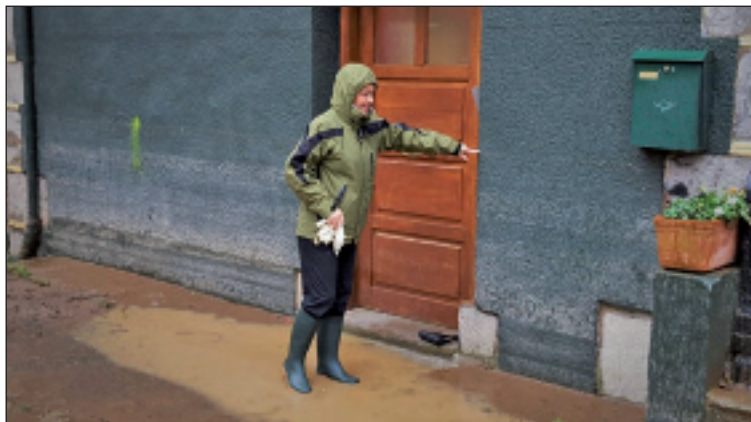
Garagartzan urak hartutako maila erakusten du emakume honek.