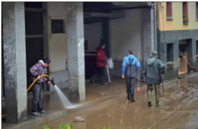
Domekan garbitze lanak izan ziren Mendaron eta Altzolan.

A ltzolako estazioan arrisku maila gairitu zuen Deba ibaiak aurreko zapatuan, otsailaren 27an. Metro koadroko 61,3 litro neurtu zituen. Deba eta Kilimon ibaiak, beraz, erabat hazi ziren eta izua eragin zuten. Mendaroko Garagartzan eta Altzolako behe solairuetako lokaletan izan ziren kalterik handienak. Elgoibarko bidegorri hasieran zulo handia eragin du urak. Alzola ur enpresak Urkulu eta Aixolako urtegien kudeaketa egokia eskatu du horrelakorik berriz ez gertatzeko.