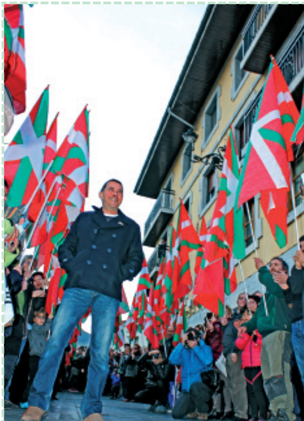
Arnaldo Otegi plazara sartu zeneko unea.