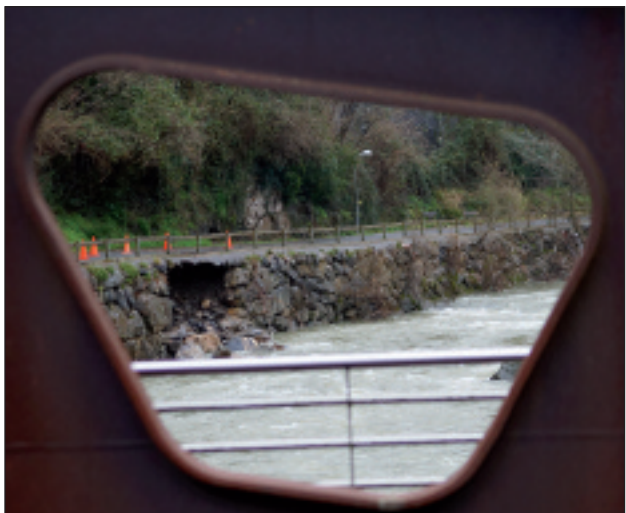
Bidegorri hasieran urak egindako zuloa.