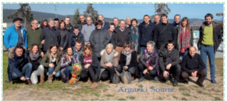
Lagunekin eta senideekin Logroñotik bueltan.