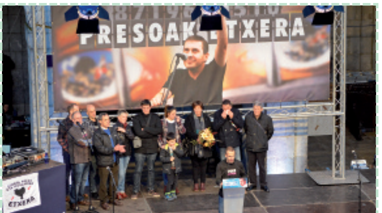
Arnaldo askatu plataformak bere jarduna amaitutzat jo du.