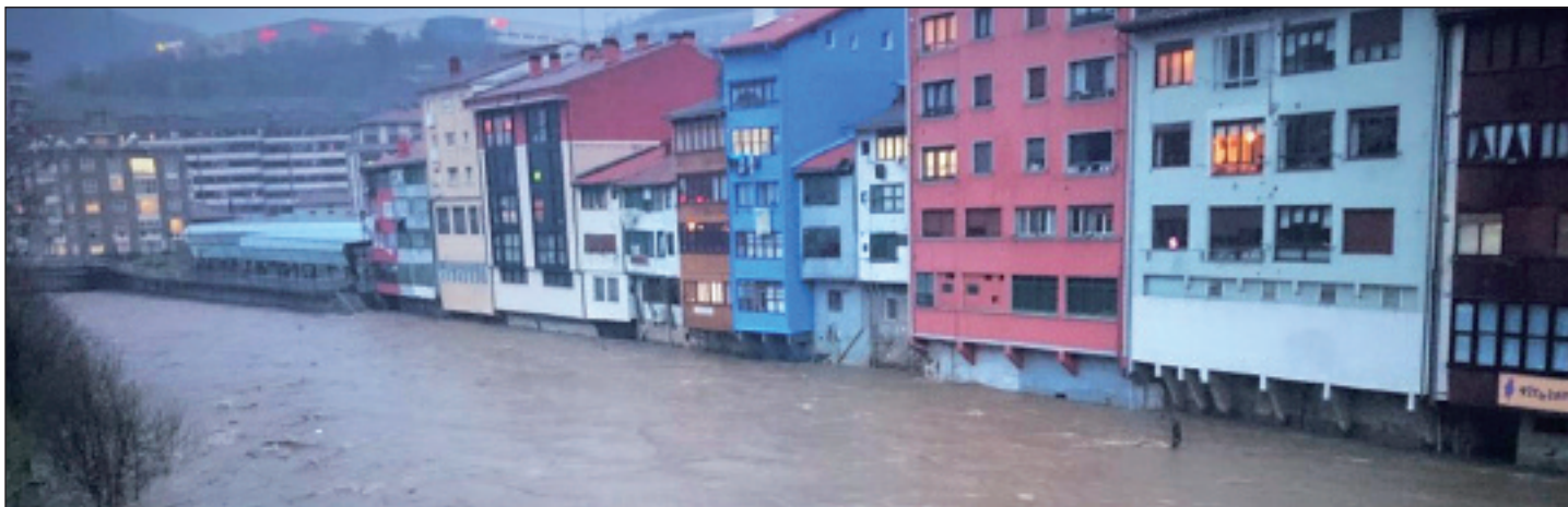
Deba ibaia oso hazita etorri zen zapatu arratsaldean. Udaltzainek uholde arriskuaren abisua zabaldu zuten Elgoibarren.