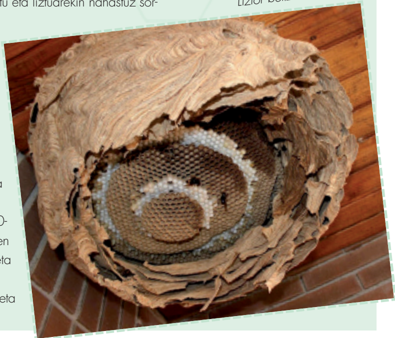
Liztor beltzaren habia.