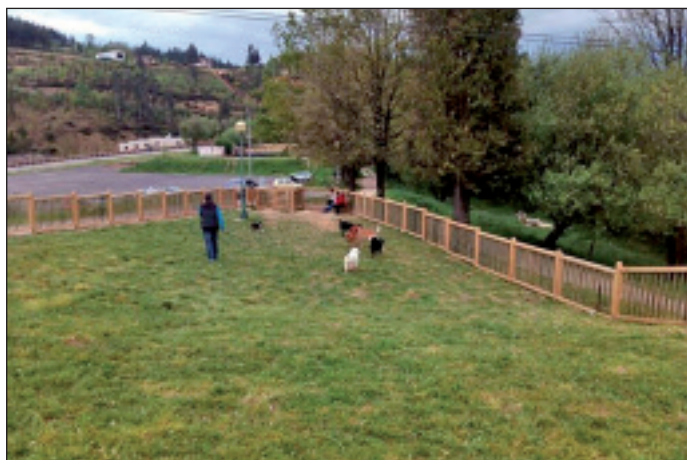
Txakurrentzako egokitutako gunea, Ermuan.