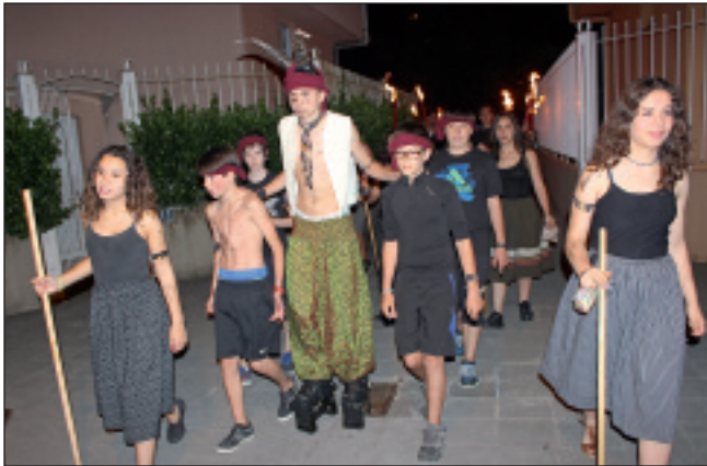
Akerbeltz eta bere segizioa, Trinidadetik jaitsi ziren plazara.

Suaren bueltan eta jai-giroan ospatu zuten udaren etorrera Elgoibarren eta Mendaron, San Joan bezperan. Elgoibarko Izarrak Ekigain jaia egin zuen estreinakoz Sallobenten eta 200 bat lagun batu ziren suaren bueltan. Altzolan, berriz, San Joan festak ospatzen dihardute oraindik, eta hango ohiturari jarraituz, ibaian piztu zuten sua. Mendaron, bestalde, akelarrea prestatu zuten Lurdotekako eta Gaztelekuko kideek, udari ongi-etorria egiteko. Argazki gehiago eta bideoak ikusteko: www.barren.eus