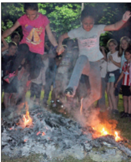
Su gainetik salto egin zuten.