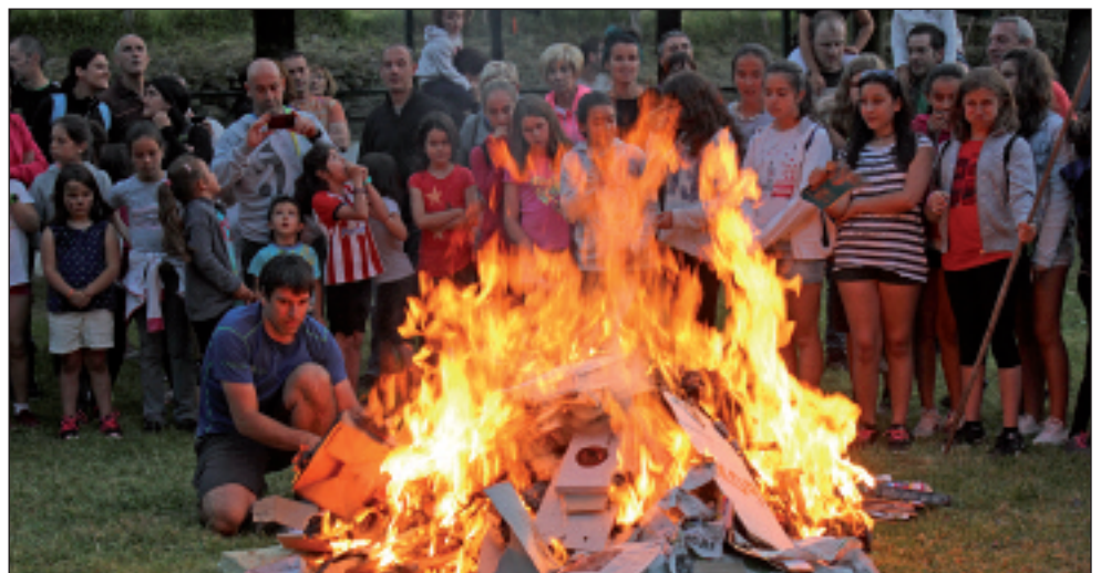
Sua piztu, eta haren bueltan dantza egin eta abestu zuten Sallobenten.