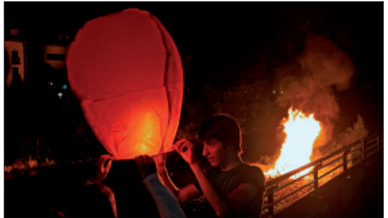
Su argiak zerurantz bidali zituzten Altzolan.