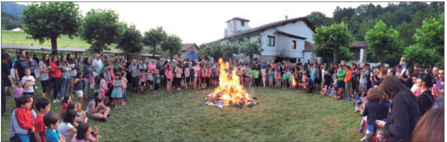
Ekigain jaia antolatu zuen Elgoibarko Izarrak estreinakoz, eta 200 bat lagun batu ziren Sallobenten, suaren bueltan.