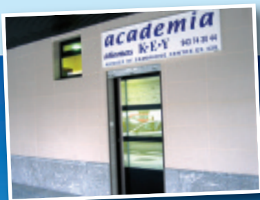
Cambridge Unibertsitateko azterketarako batzordeko kidea ES438