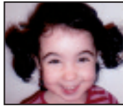
• Zorionak, printzesa , zure laugarren urtebetzean. Etxeko-koen partez.