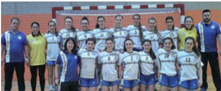
Jubenilek Ermuan jokatu zuten.

Txarriduna eta Ikus taldeak, Gipuzkoako finalerdietan