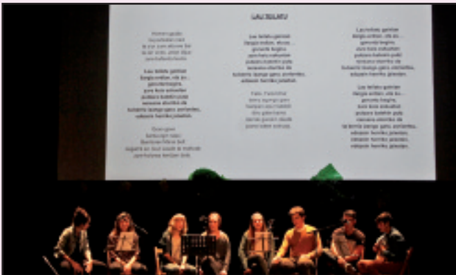
BH Institutukoek Herriko Antzokian ospatu zuten.