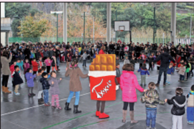
Ikastolako patioan egin zuten Mendaron euskararen aldeko jaiak.