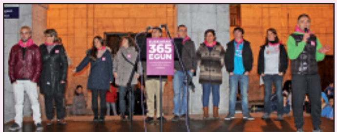
Antolakuntzako kideek euskararen aldeko manifestua irakurri zuten.