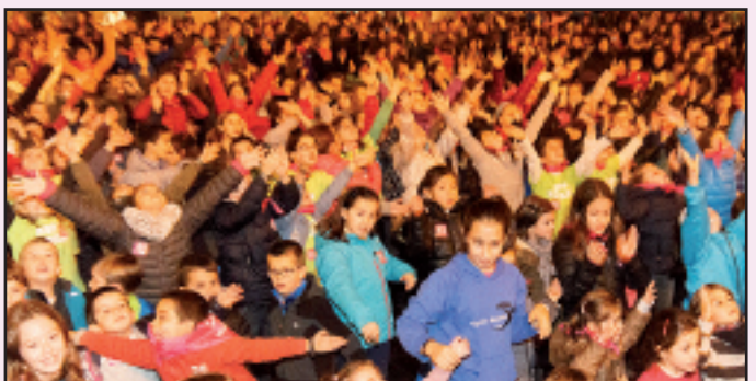
Euskara plazara eramán zuten hainbat eta hainbat herritarrek.