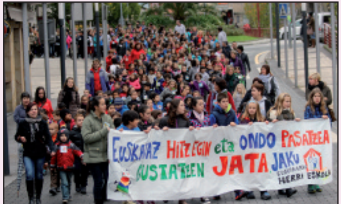
Herri Eskolakoek kalejira egin zuten.

A banduaren 3 Euskararen Nazioarteko Eguna da, eta horren harira hainbat eta hainbat ekintza antolatutatu zituzten Elgoibarren eta Mendaron. Orri honetan jaso dugu egunaren laburpena iruditan, baina argazki gehiago eta Kalegoen plazan egin zuten flash mob-aren bideoa www.barren.eus atarian duzue.