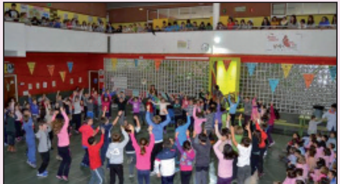
Ikastolan ere ez ziren falta izan euskararen aldeko ekintzak.