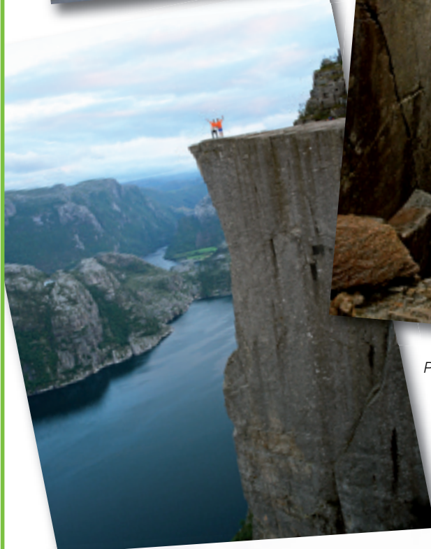
Pulpito haitza, Preikestønen.