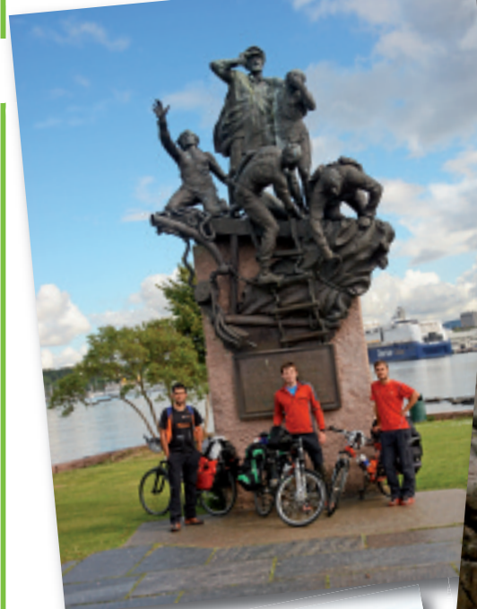
Hiru elgoibartarrak Osloko monumentu baten ondoan.

Komunikatzeko ingelesez hitz egiten zuten, eta abilezia handirik ez dutela esan badute ere, uste baino hobeto moldatu dira: “Nahi genuena jan eta nahi genuen tokian egiten genuen lo”, esan dute umorez. Horrez gainera, ez dute haserterik izan euren artean: “Egun asko pasatu behar genituen gau eta egun elkarrekin, eta bageneukan beldur pixkat, baina primeran moldatu gara”, esan dute irribarrez. Nekatuta, eta apur bat argalduta itzuli dira etxera, baina dagoeneko hasi dira hurrengo espedizioa prestatzen. Ez da datorren urtean izango, dirua aurrezteko denbora behar dutelako, baina hiruzpalau urte barru berri abiatuko dira gupil gainean oporretara.