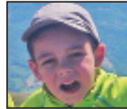
• Zorionak, Gari! Gure Tiranosaurux Rex handiak 6 urte bete ditu! Patxo haundi bat, familia osuaren partez, eta ondo pasau! Grrr...