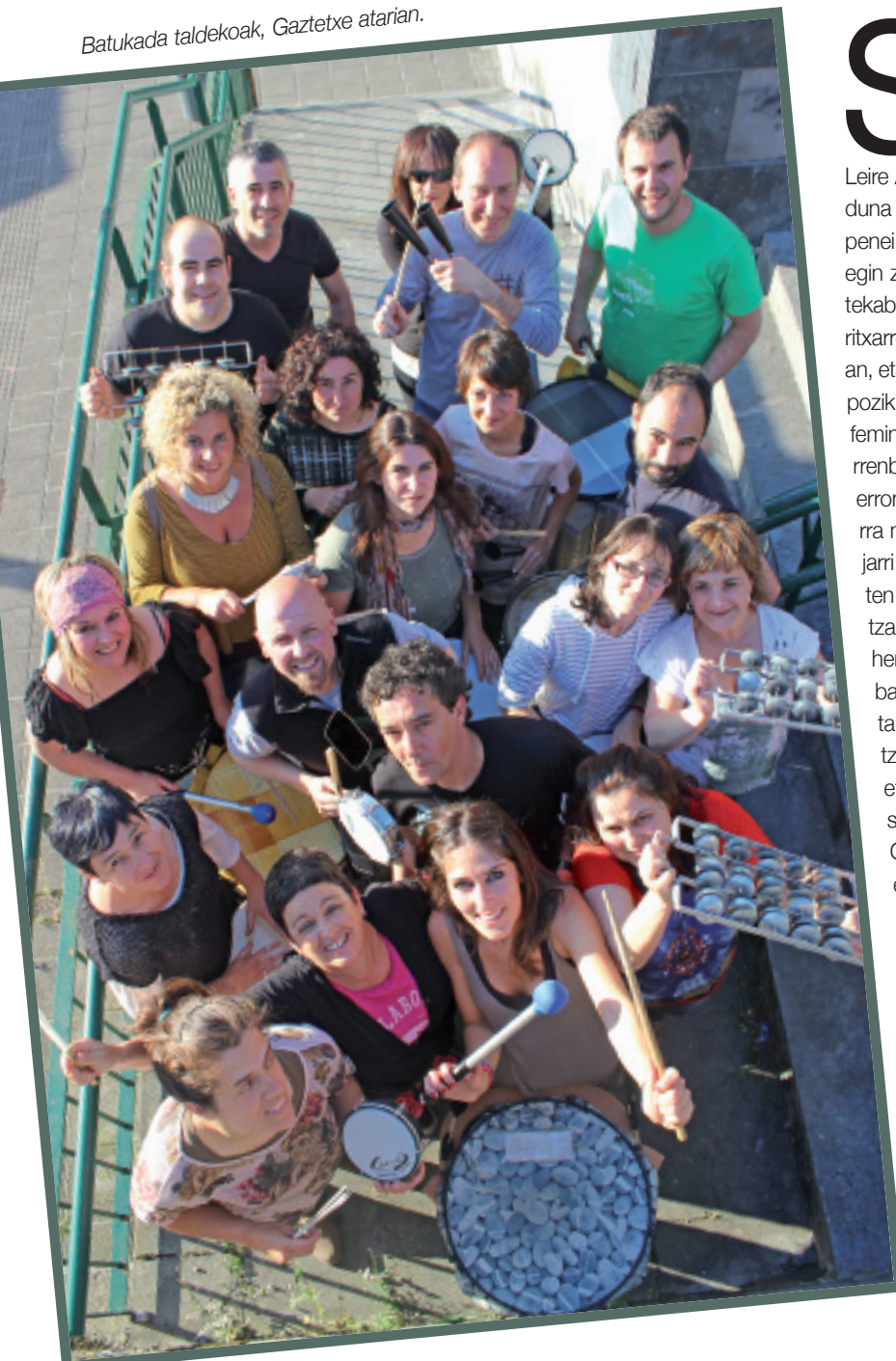
Batukada taldekoak, Gaztetxe atarian.