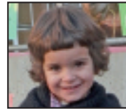
• Zorionak, Jare , igandean 3 urte beteko dituzulako. Ederki pasatuko dugu lagun eta familiakoekin.