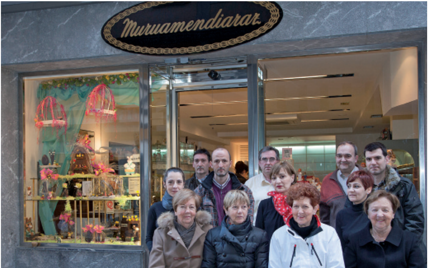
Muruamendiaraz gozotegiko koadrila, gozodenda aurrean.

Gipuzkoako zazpi pastelgile artisaturen ekimenez antolatu dute biharkoa, eta tartean daude Muruamendiaraz gozotegikoak