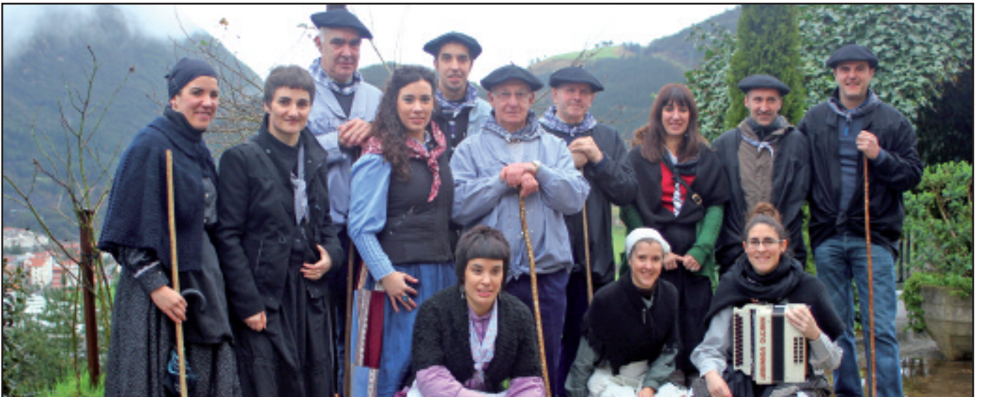
Herriko kale eta baserri guztiak koplatu zituzten Mendaron, hiru taldetan banatuta. Argazkian, taldeetako bat.