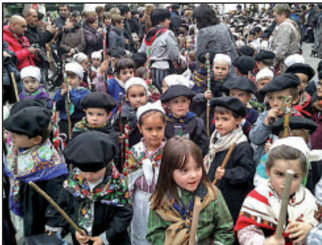
Elgoibar Ikastolako ikasleak kalejiran, Santa Ageda bezperan.