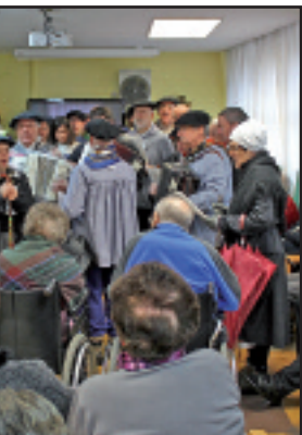
Lazaro egoitzan kantuan.