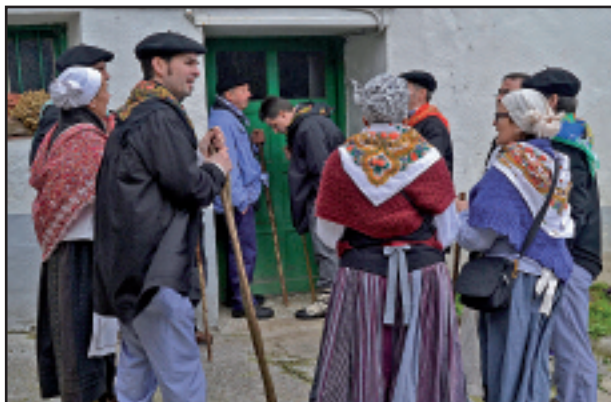
Areitio eta Meababasterretxea Urkiola Handin bertsoan.