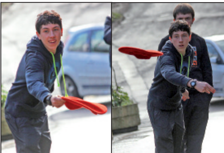
Dotoreziaz jaurti zituzten txapelak IMHn.