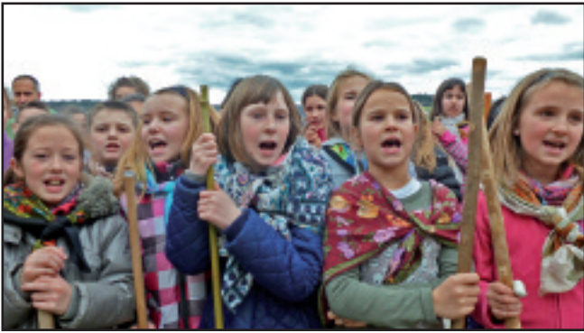
Herri Eskolako ikasleak, makila eskuan eta kopla zaharrak ahoan.