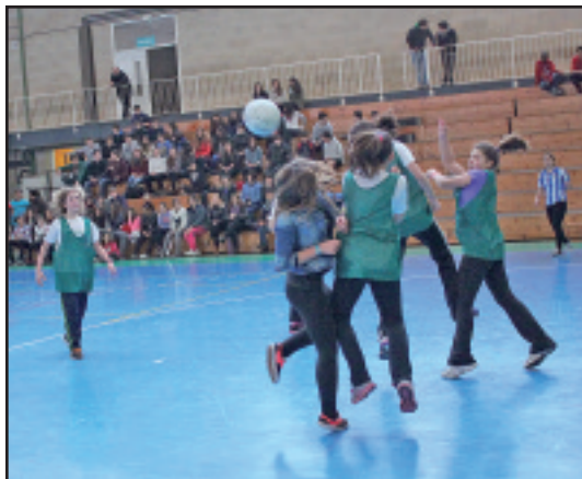
Giro onean joan zen futbito txapelketa.