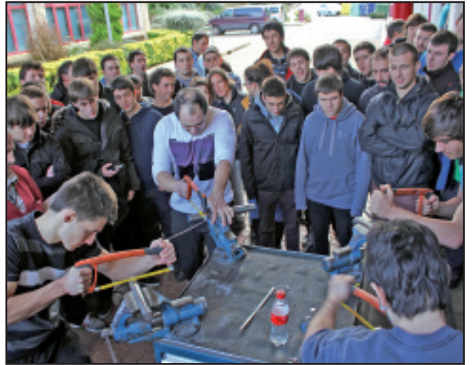
Tailerreko tresnak erabiliz, txapelketa bitxia egin zuten IMHn.