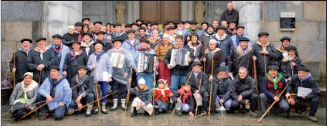
Etxegiña taldearekin 75 lagun inguru aritu dira aurten.