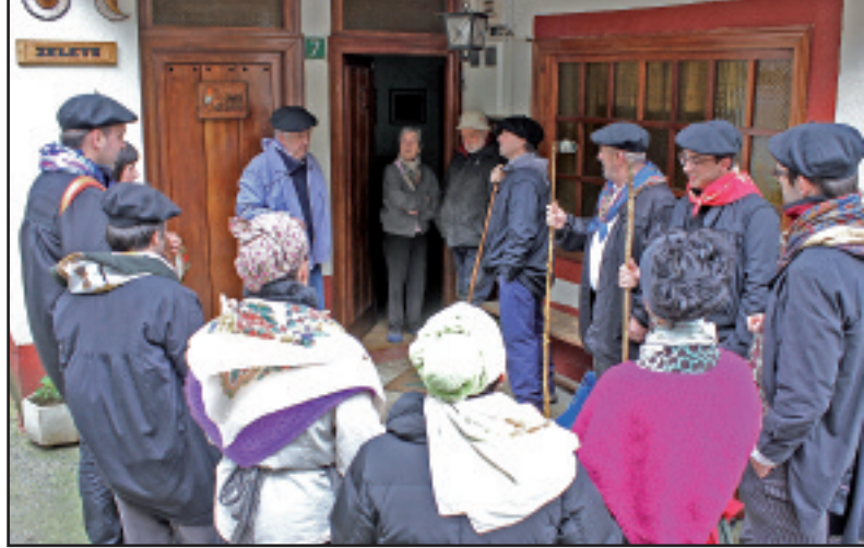
Narbaiza eta Ziarda bertsotan, koplarietz inguratuta, Zeleta baserriko atarian.