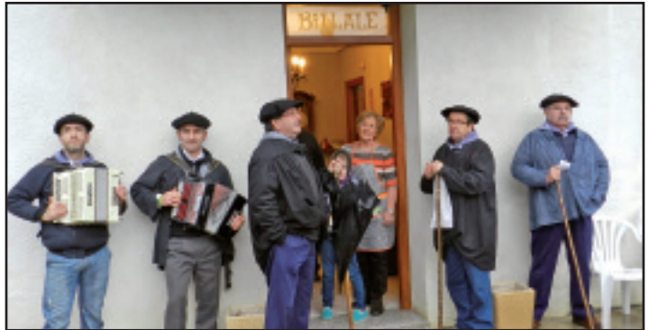
Billale baserriko atarian.