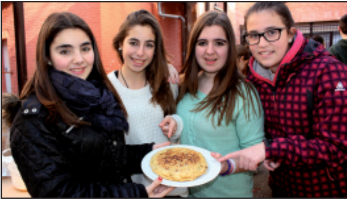
Sukaldean trebeak direla erakutsi zuten ikasleek.

E guneroko eskolak alde batera utzita, San Juan Bosco Eguna ospatu zuten BH Institutuan eta Mekan, eta IMHkoek berriz, IMH Eguna ospatu zuten. Argazki gehiago eta bideoa: www.elgoIBARREN.net