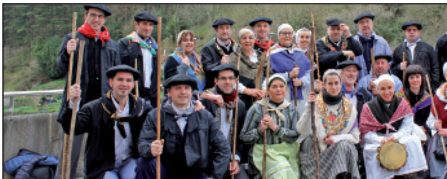
Elgoibarko Izarra kultur elkarteak 25 lagun inguru batu zituen santa eskean aritzeko.