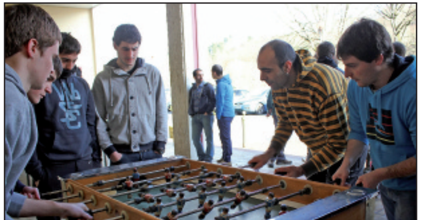
Emozio eta lehia bizia izan zen IMHko futbolin txapelketan.