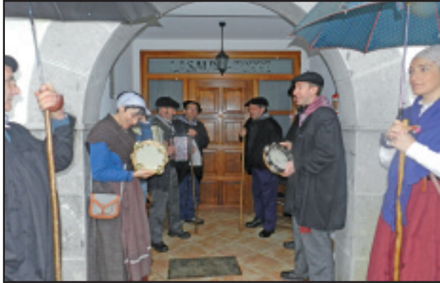
Lasalde-Torre baserriko atarian.