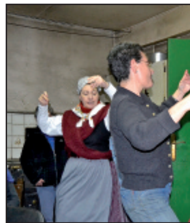
Harrera beroa eta dantzarako giroa