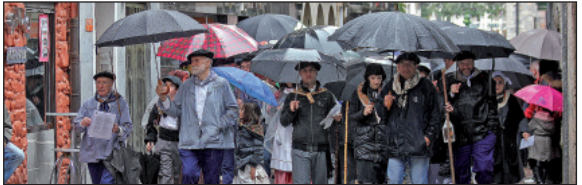
Etenik gabe egin zuen euria joan den zapatuan, baina horrek ez zituen santa eskeko koplariak kikildu.