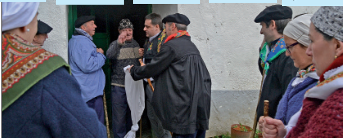
Urtero legez, baseritarrak ondo baino hobeto portatu ziren limosna emateko orduan.

Argazki gehiago eta bideoa: www.elgoiBARREN.net