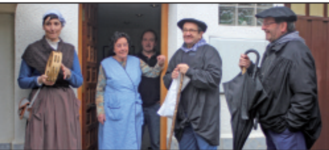
Batutako dirua Ameikutz Musika Eskolari emango diote Mendaron.