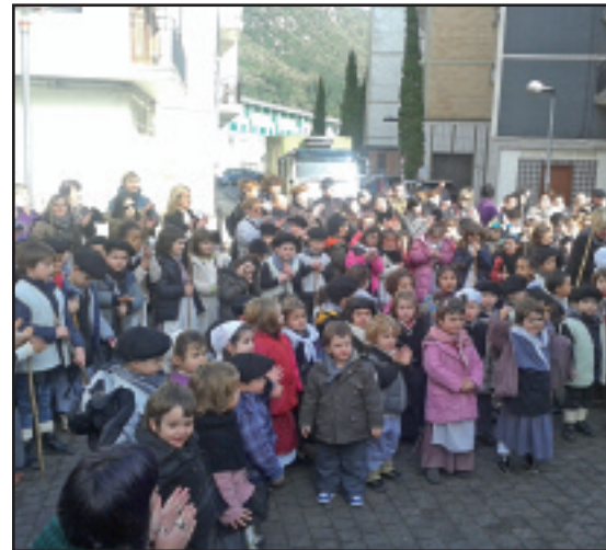
Mendaroko ikasleak Mendarozabalen kantuan.