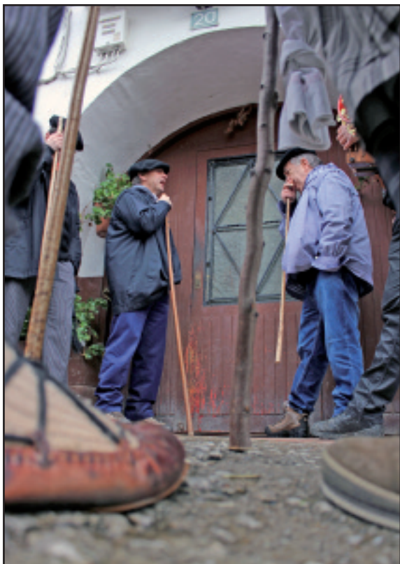
Etxean norbait dagoen jakin ez arren, abestu egiten dute.