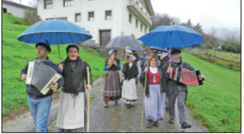
Mendaroko Santa Eskeko taldea, Bideburu baseritik bueltan.