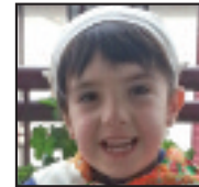
• Zorionak, Leireri, 5 urte bete dituen printzesari, etxeko guztien partez. Besarkada bat eta patxoak.