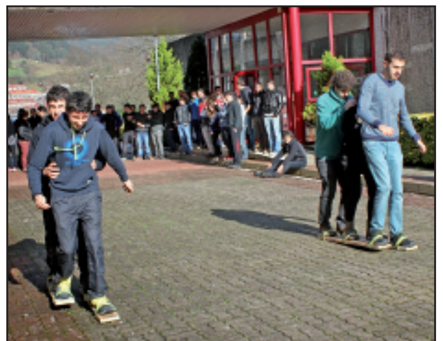
Ez zen umorerik falta izan IMH Egunean.