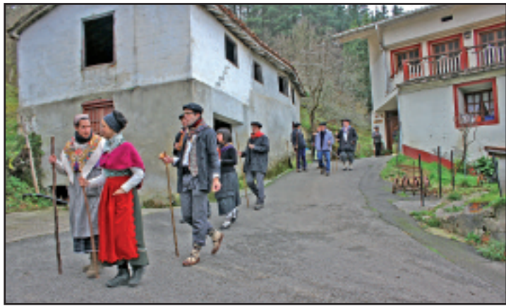
Elgoibarko Izarrakoek 43 baserri koplatu zituzten Santa Ageda bezperan.