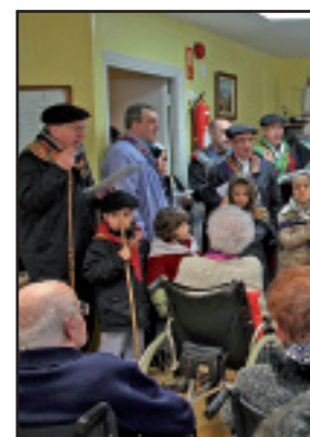
Etxegiña taldeko kideak Sa