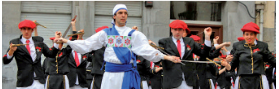
Domekan, ezpata dantza izango da egitarauko ekitaldi nagusia.

Gaur, 18:00etan, Kiribil ere batuko da Errosario kaleko ospakizunetara. Atxutxia- maikako, Elgoibarko Izarraren aisialdi taldeko, lagunek haurrentzako ikuskizuna eskainiko dute. Ondoren, 19:00etan, Mauxitxa txarangakoak kalejiran irtengo dira, buruhandiek lagunduta, eta ordu erdi geroa-