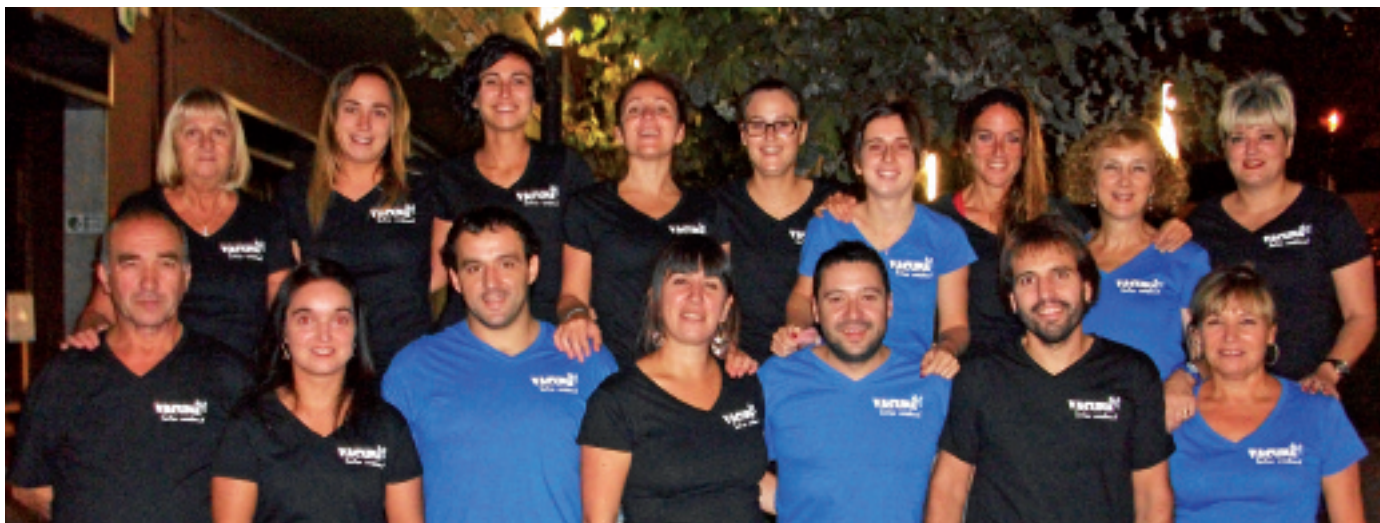
Elgoibarren astero dantzarako batzen den lagun taldea.

Ehundik gora dantzarik eman dute jaialdirako izena dagoeneko