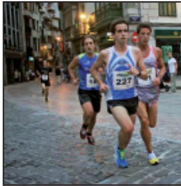
Lasterketako lehen hiru sailkatuak ahalegin betean.