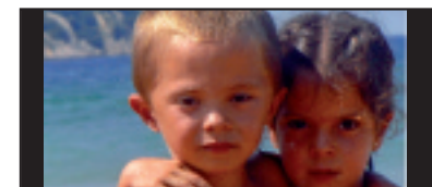
• Zorionak bikote! 7 urte bete dituzuelako. Muxu handi bat familia guztiaren partez.