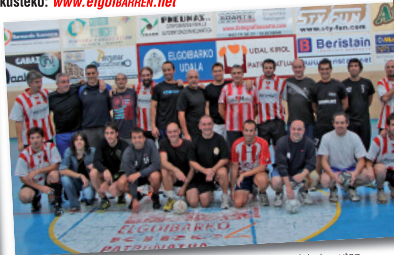
Gizonezko beteranoek bi talde egin eta elkarren kontra jokatu zuten.