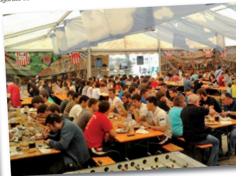
Jende asko batu zen domekan paella jateko.