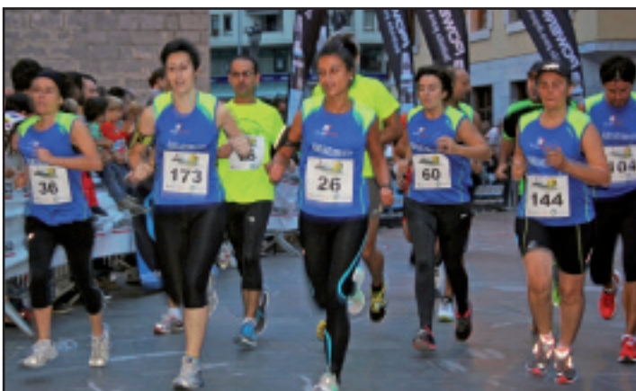
Korrika egiteko elastikoak banatu zituzten antolatzaileek.