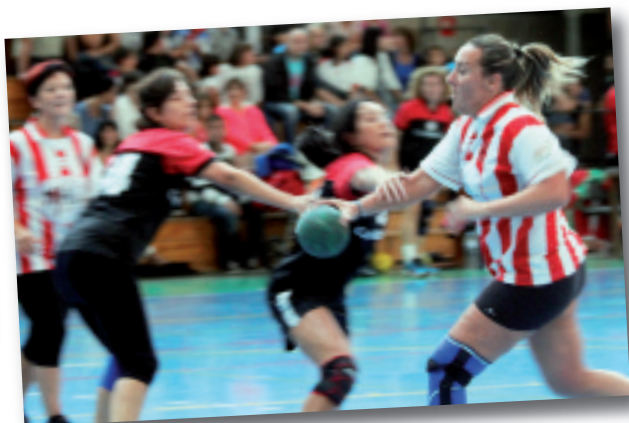
13na berdindu zuten partida emakumeek.