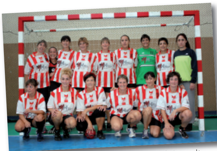
Gasteizko taldearen kontra jokatu zuten emakume beteranoek.

Oporrak amaitu dira eta Sanlo eskubaloia taldea hasi da lanean. Joan zen asteburuan eskubaloia eta jaia uztartu zituzten, SanloBEER festaren barruan, eta egitarau oparoa prestatu zuten astebururako. Eguetik domekara bitartean egin zuten garagardo feria, klubarentzako finantzazioa lortzeko, eta arduradunek esandakoaren arabera, herritar asko ibili ziren Maalan jarri zuten karpa erraldoian. Garagardo eta saltxitxak tarteko, kirolak ere izan zuen lekua asteburuan: hezurrei hautsa kendu eta kantzara itzuli ziren berriz beteranoak, emakumeak zein gizonezkoak, eta klubeko taldeen aurkezpena egiteko ere baliatu zuten asteburua. Argazki gehiago ikusteko: www.elgoibarren.net