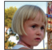
• Zorionak, June maitxia! Edarto pasa genuen zure 5. urtebetetze egunean. Patxo goxo bat guztien partez eta marrubizko bat Malenen partez.