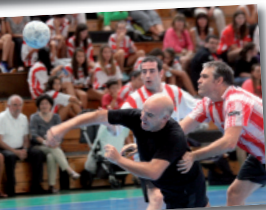
Giro bikina izan zen kiroldegian.