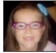
• Zorionak, Udane , astelehenean 7 urte egin zenituelako. Etxeko guztien partez, eta bereziki, Goiatzen partez.