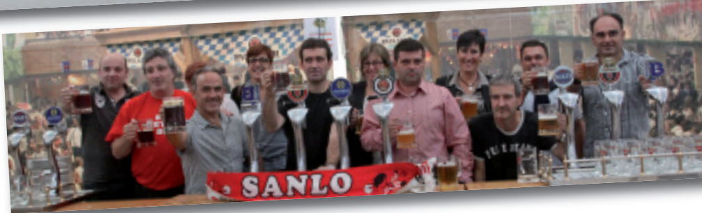
Udal agintariekin inauguratu zuten SanloBEER festa.