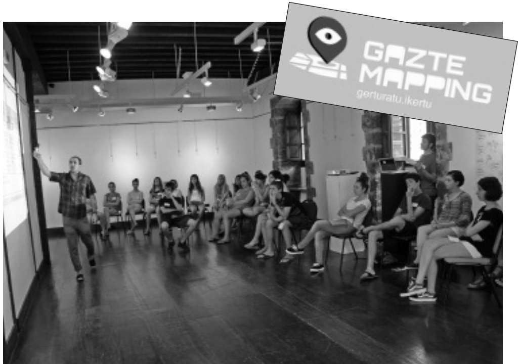
30 bat gaztek hartu dute parte lehenengo tailerlean.

G erturatu eta ikertu. Horixe da Manahmana enpresak Elgoibarko gazteei proposatu nahi diena Gaztemapping egitasmoan. 13 eta 30 urte bitarteko gazteen interakzioa sustatuz, Elgoibarko aisialdia aberastu nahi dute. Gazteek gazteentzako egindako proiektua da, eta gazteak izango dira protagonistak; ikertzaileak eta ikertuak, hain zuzen ere. Ikerketa-ekintza proposamen honetan hamabost gazte ikerketailek beraien inguruko beste hogeitazaz gazteren ohiturak ikertuko dituzte. Elgoibarko balibideen erabilera, gazteen partaidetza, beharrak eta interesak izango dira aztergaiak, besteak beste.