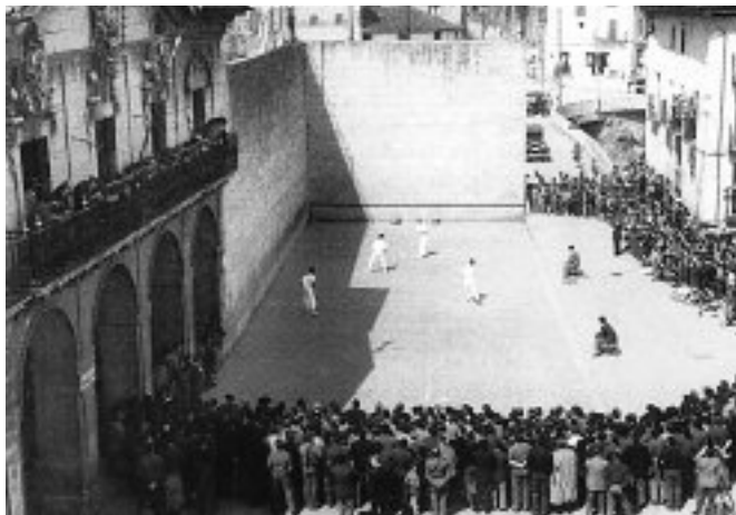
Goiko argazkiko irudia erreplikatu nahi dute San Bartolome Egunean.

1751n eraiki zuten Kalegoen plazako frontoia, eta Araba, Gipuzkoa eta Bizkaian ez da egundaino Elgoibarkoa baino frontoi zaharrago baten eraikuntzari buruzko idatzirik aurkitu. 1963an hartu zuen gaur egun daukan itxura. 1963an ospatu zen Gontzagako