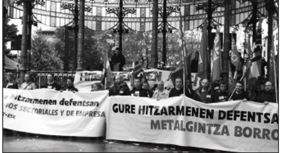
LABeko, CCOOko eta UGTko ordezkariak Donostian egindako elkarretaratzea.