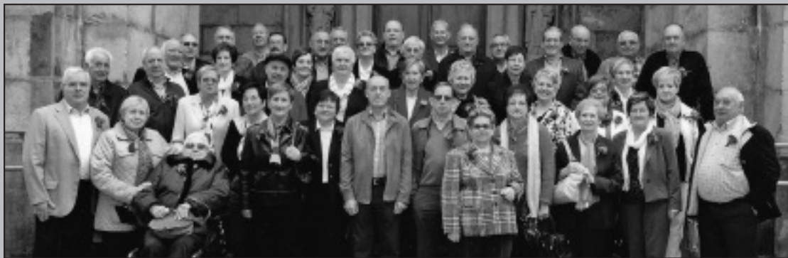
Egun polita pasatu genuen elkarrekin 1943an jaiotakook . Errepikatzeak merezi du!.

• Zorionak, June , Dagoeneko 2 urte, neska handi! Muxu bat familiakoen partez. Ondo pasa, maitia!