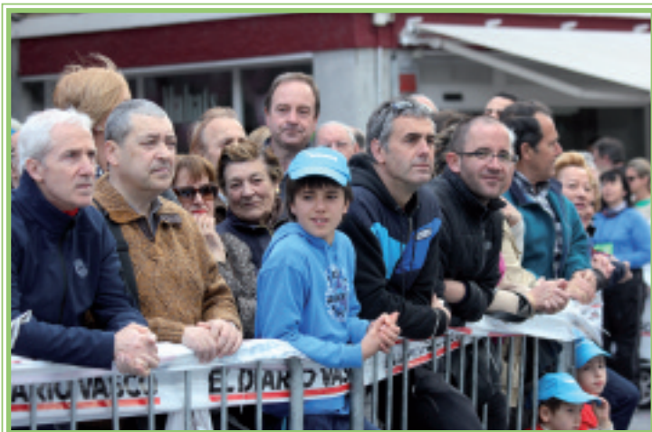
Plaza jendez gainezka egon zen bi egunetan. Asteartekoa da irudia.