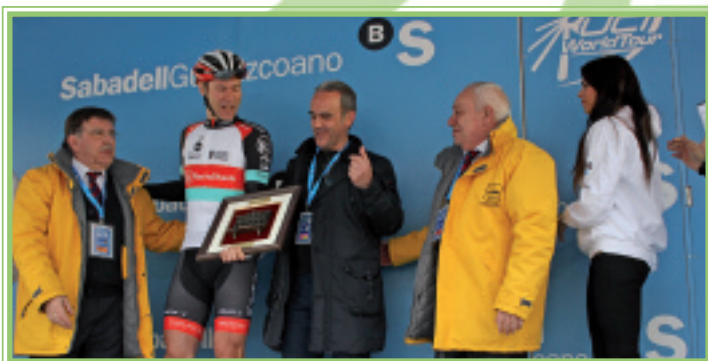
Jens Voight omendu zuen antolakuntzak Elgoibarren.