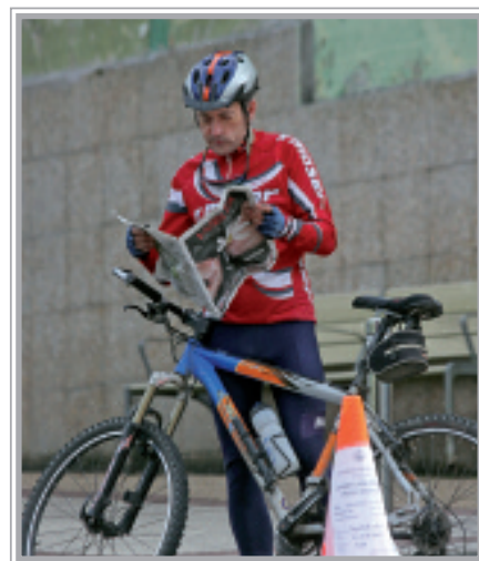
Profila, ibilbidea... Zaleak, informatzen.