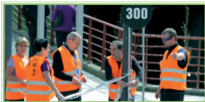
Elgoibartarrak, gurutzaguneak zaintzen.