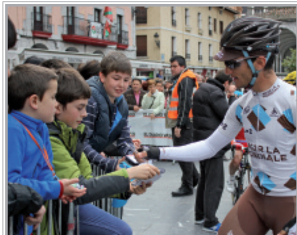
Gaztetxoek gogotik gozatu zuten.