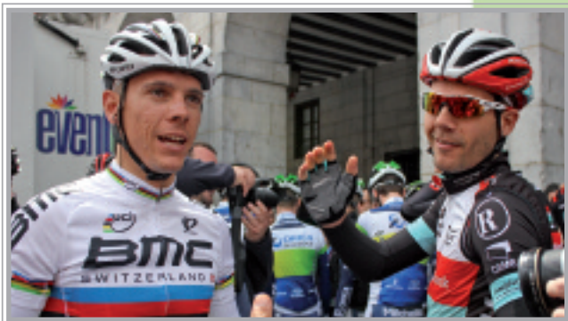
Philippe Gilbert eta Maxime Monfort, irribarretsu, irteeran.