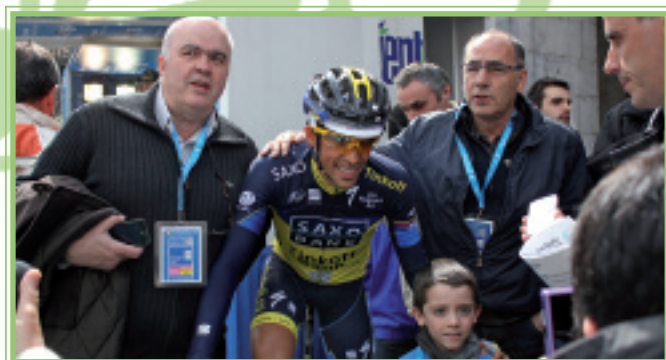
Elgoibartarrak Alberto Contadorrekin.