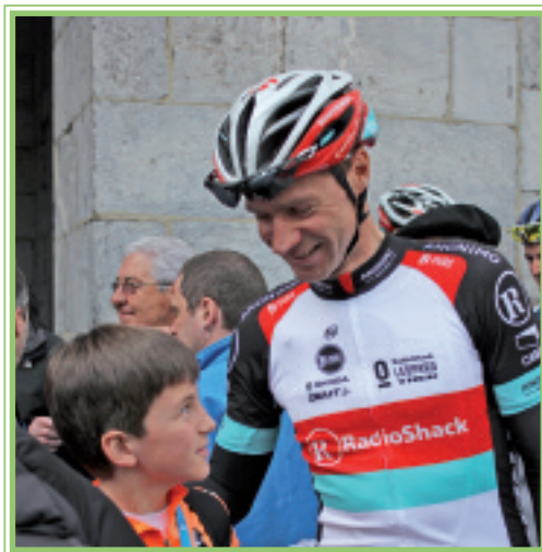
Jens Voight, adeitsu, zaletxo gazte batekin.