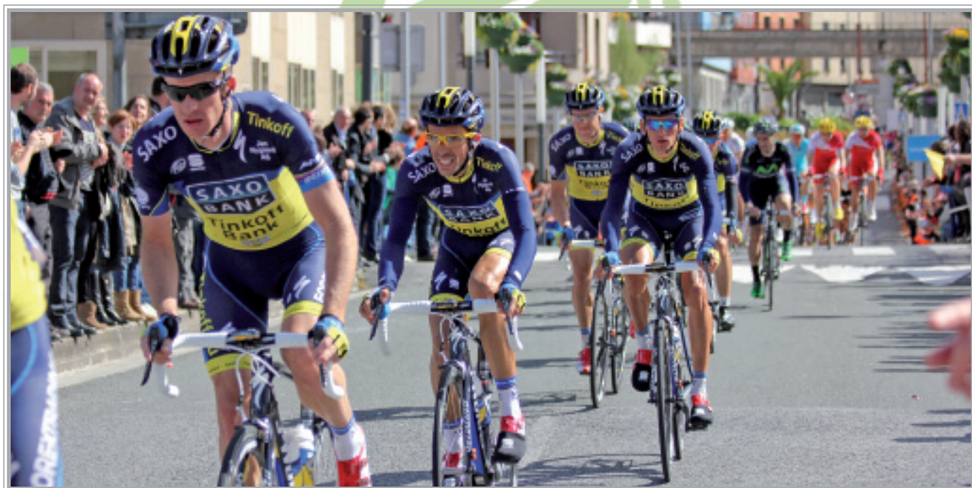
Saxobank taldekoak ahalegin betean, tartean Alberto Contador hortzak estututa.