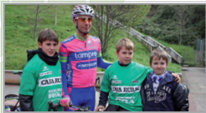
Zaleek ez zuten protagonisten ondoan egoteko aukerarik galdu.