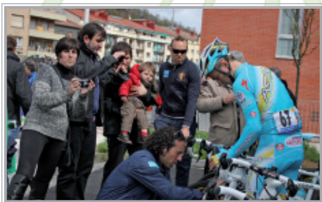
Profesionalak, lasterketa abiatu aurreko azken ukituak egiten.