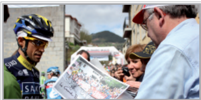
Alberto Contador, Kalegoen plazan, zaleen eskariei erantzuten.