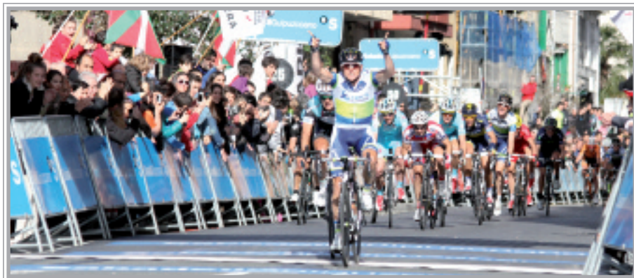
Simon Gerrans, asteleheneko garailea, besoak altxata, helmugan sartzean.