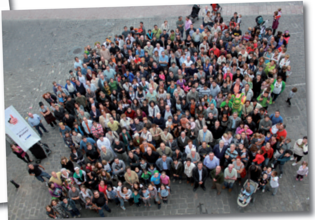
'Ni ere banaiz BARREN' kanpainaren harira ateratako argazkia.

E lgoibarko Izarra kultur elkarteak BARREN astekariari buruzko ikerketa sakona egin zuen 2009an, Aztiker ikerketa-enpresaren laguntzarekin. Batetik, astekariaren irakurleen profila ezagutu nahi zuen elkarteak, eta bestetik, herritarren iritziak jaso nahi zituen. Hiru zatitan egin zuten ikerketa: lehenengoan, idatzizko inkestak bidali zituen etxeetara BARRENEK (4.500 guztira); bigarrenengoan, herriko hainbat eragilerekin hamabost elkarrizketa inguru egin zituen euren iritzia jasotzeko; eta hirugarrenengoan, telefonozko inkestak egin zituzten. Elgoibarko eta Mendaroko 725 etxetara deitu zuten Aztiker enpresako adituek, adin eta sexu diferenteetako herritarren iritziak jasotzeko.