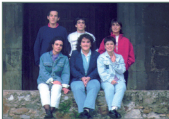
KiliBARRENEko hasierako lantaldeko sei lagun, Trinitaten.