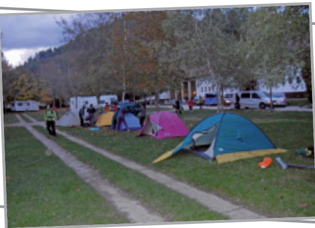
Bigarren egunean Otsagiko kanpinean pasa genuen gaua.