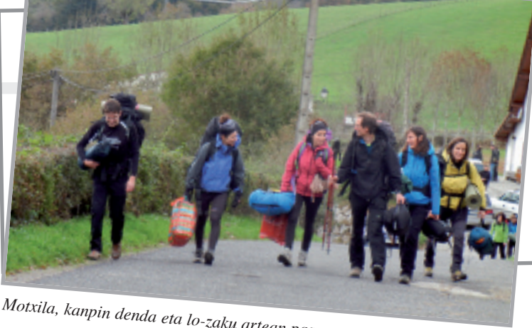
Motxila, kanpin denda eta lo-zaku artean pasa genuen lehen gaua.

Orreagan hasi eta Belaguaraino eram gaitu Morkaiko Mendizale Elkarteak. Motxilak bizkarrean hartuta, Iratiko basoaren igurtzia somatu dugu behin eta berriz, nafar mendietara ongi-etorria eginez.