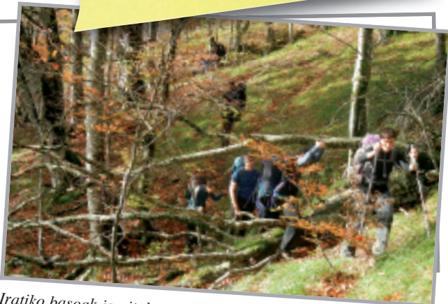
Iratiko basoak jarritako oztopoak gaindituz.