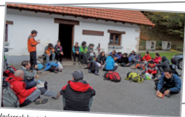
Indarrak hartzeko, ez dago Azpegiko aterpetxean mokadutxo bat jatea bezalakorik.