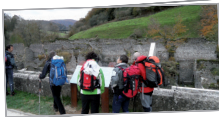
Orbaitzetako arma fabrika zaharra ikustera ere iritsi ginen motxila eta guzti.