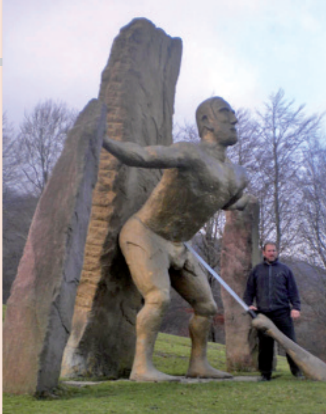
Peru-harriko eskulturetako bat.

Izan ere, Peru-Harriren bitartez zuk harria ez ezik, herria ere erakutsi nahi diozu hara joaten den bisitariari.