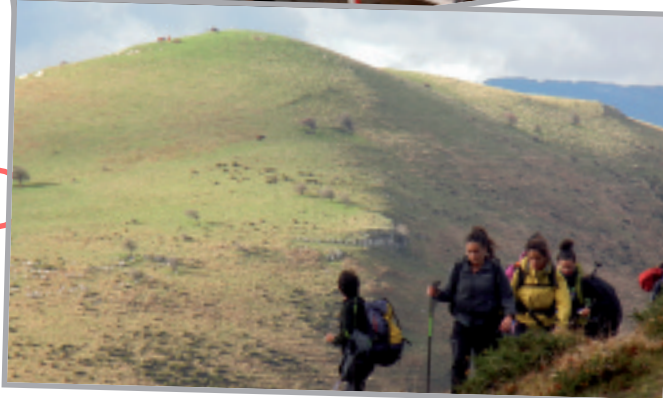
Orreaga-Belagua mendi ibilaldia.