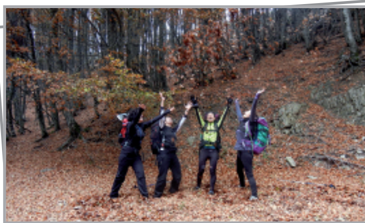
Udazkena heldu da... hostoekin jolasteko tartea ere izan zuten mendizaleek.