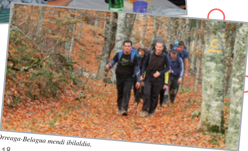
Orreaga-Belagua mendi ibilaldia.