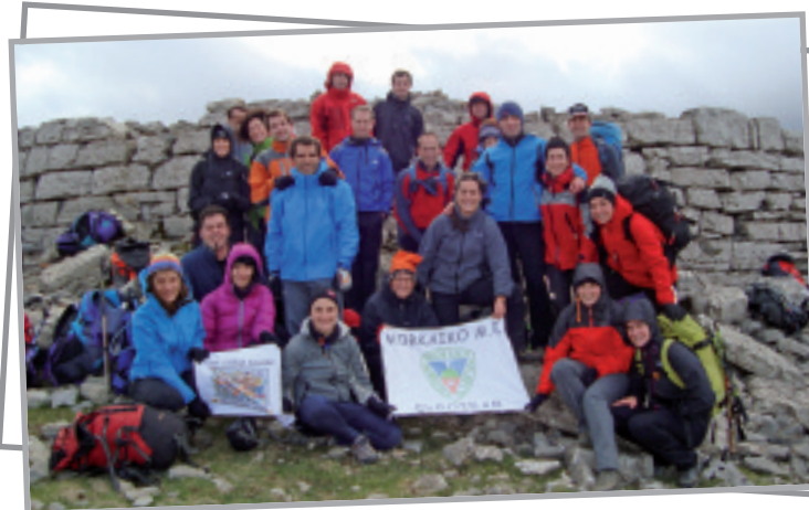
‘Izan haize, izan euri’, taldeak dotore erantzun zuen. Urkulu mendiaren gailurrean.