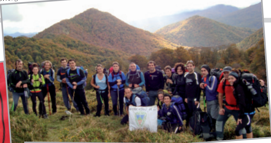
Orreaga-Belagua mendi ibilaldia.