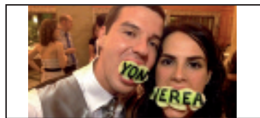
• Zorionak, bikotel Primeran pasa genuen zuen ezkontza egunean. Muxu handi bat, Urazandiko lagun partez.