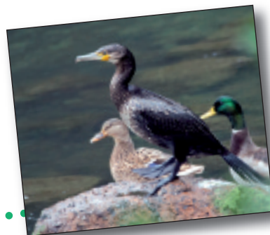
UBARROI HANDIA, Phalacrocorax carbo

Paduretako (itsasoak eta ibaiak bat egiten duten lekua) hegazti-espezia da, eta moko fina lokatzetan sartuta bertako zizareez elikatzen da, batez ere.