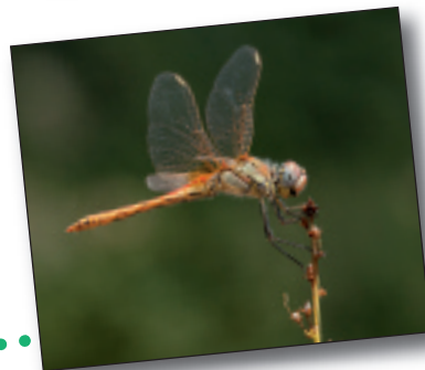
SYMPETRUM FONSCOLOMBII BURRUNTZIA

Ur-inguruneetara ederki moldaturiko sugea da, eta bertako intsektu, arrain eta igelez elikatzen da, batez ere. Igerilari trebea da.