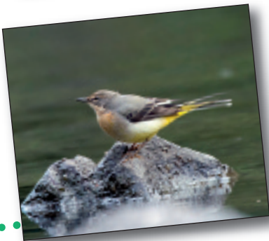
BUZTANIKARA HORIA, Motacilla cinerea

Ibai eta erreketako txoririk arruntenetarikoak da, eta ibaie-tan bizi diren intsektuen larbez eta intsektu hegalariez elikatzen da.