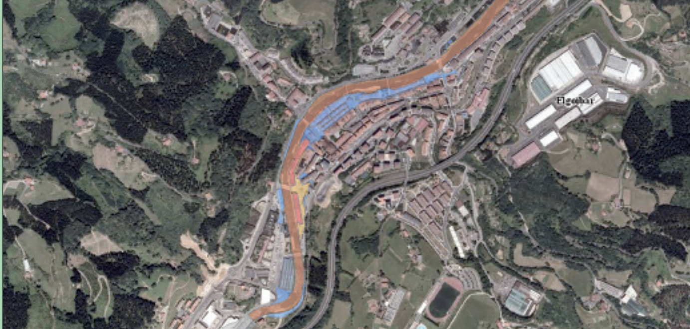
Gorriz, hamar urtean behin ur azpian gelditzeko probabilitatea duen eremua; horiz, ehun urtean behin; eta, urdinez, 500 urtean behin. Hirigunearen zati handi bat bostehun urteko itzulketa-epealdiko eremuaren barruan dago. Jatorria: Eusko Jaurlaritza ( www.geo.euskadi.net )