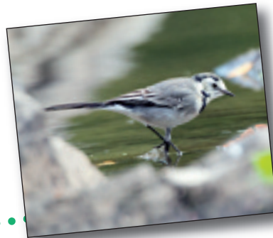
BUZTANIKARA ZURIA, Motacilla alba

Deba ibaiko hegazirik arruntena da, eta denetariko elikagaiak jaten ditu: landareak, intsektuak, barraskiloak eta baita jendeak botatako janaria ere.