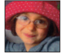
• Azkenean 5 urte! Zorionak! Aita, ama eta Aselen partez. Muxu bat.