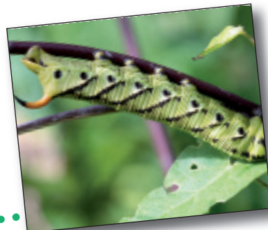
CONVOLVULI ESFINGEA, Agrus convolvuli

Ez da buztanikara zuria bezain arrunta, baina oso bizi-modu antzekoa du.