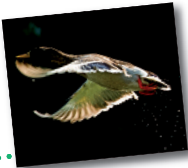
BASAHATEA, Anas platyrhynchos

Ohikoa da ibai inguruetan fauna oparoa aurkitzea, animaliek ura ezinbestekoa dutelako bizitzeko. Deba ibaiaren inguruan ere badira animaliak, baina egon beharko luketenak baino gutxiago, besteak beste, Deba ibaia eta mendia ez daudelako komunikatuta Elgoibarren, eta hori ezinbestekoa da animaliak ibaira gerturatzeko. Leku bakarra dago baldintza hori betetzen duena: Lerungo meandrea. Inguru honetan basoa eta ibaia elkarren ondoan daude, eta animalia asko batzen dira han, dela ura edateko edota freskatzeko. Alberdik argazkilaritzarako zaletasuna eta pazientzia ere badu, eta sarri ibiltzen da ibai bazterretan erretratuak ateratzen. Orri honetan batu ditugu Deba ibaian gehien ikusten diren animaliak.