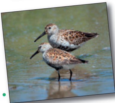
TXIRRI ARRUNTA, Calidris alpina

Burruntzien larbak ibai eta erreketako faunaren zati garrantzitsua dira, hainbat intsekturen eta anfibioaren arrautzez eta larbez elikatzen baitira.