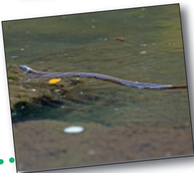
SUGE GORBATADUNA, Natrix natrix

Euskal Herriko sitsik handienetarikoak. Argazkian ikus daitekeen beldarra (sitsaren fase larbarioa) ere gure lurraldeko handienetariko bat da. 10 cm-ra iritsi baitaiteke.