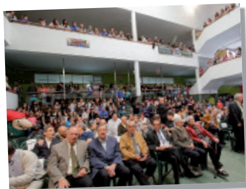
50 urteotan protagonista izan direnak batu ziren erdiko aretoan.