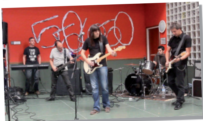
'Amets bat' abestia kantatu zuten omenaldiaren amaieran.