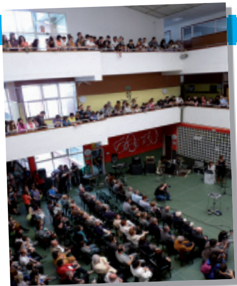
Erdiko aretoa jendez gainezka egon zen.