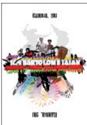
lazko kartel irabazlea

Elgoibarko Udaleko Kultura Batzordeak lehiaketa antolatuta du 2012ko San Bartolome jaietako programaren azalaz aukeratzeko. Lehiaketa horretan 18 urtez gorako edozeinek parte hartu ahal izango du, eta teknika librea erabiltzeko lanak aurkeztu ahal izango dira, gehienez ere pertsona-