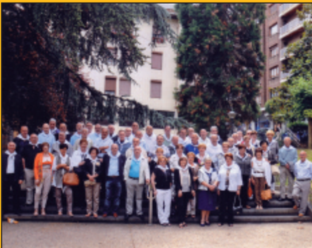
Mila esker 47ko kintoei! Oso egun polita pasatu genuen!