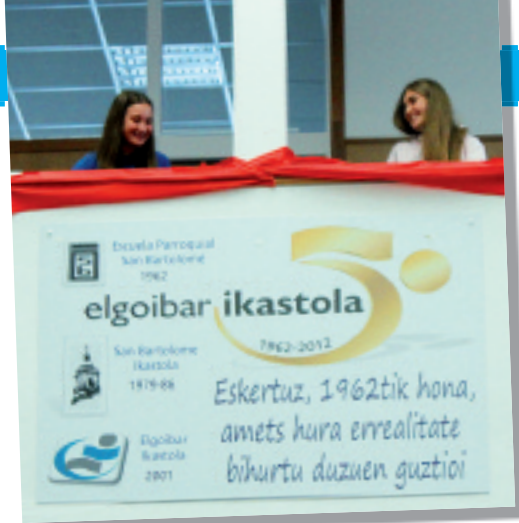
Ikastolaren 50. urteurreneko plaka bistaratu zuten.