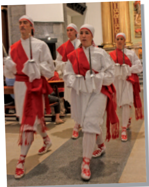
Haritz dantza taldea, parrokian.